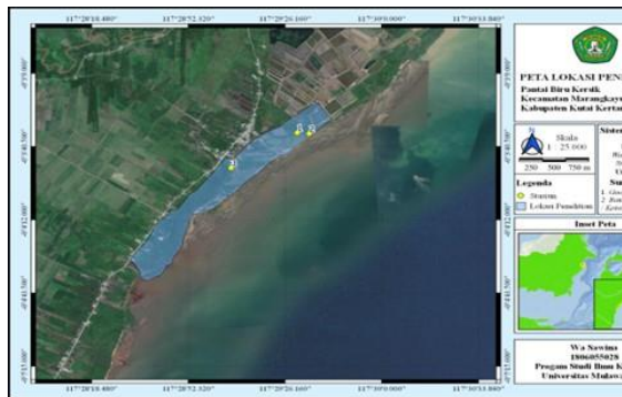
Gambar 1. Desa Kersik

Penelitian ini dilaksanakan pada bulan Agustus-September 2021 di dua lokasi penelitian yaitu di Desa Kersik (Gambar 1) dan Desa Kampung Baru (Gambar 2).