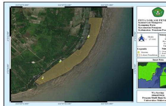
Gambar 2. Desa Kampung Baru