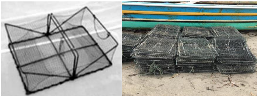
Gambar 1. Kiri: Desain konstruksi Bubu Lipat (sumber: Mahiswara, 2018); kanan: Bubu Lipat nelayan Pasar Bengkulu (sumber: dokumentasi pribadi, 2022)

Nelayan yang menggunakan kapal berukuran 1 GT memiliki anak buah kapal sebanyak dua orang dengan tenaga penggerak berdaya tahan 10,5 PK. Sementara kapal dengan ukuran sebesar 2 GT memiliki anak buah kapal sebanyak 3 orang dengan tenaga penggerak berdaya tahan 26 PK.