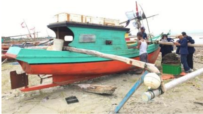
Gambar 2. Kapal alat tangkap bubu