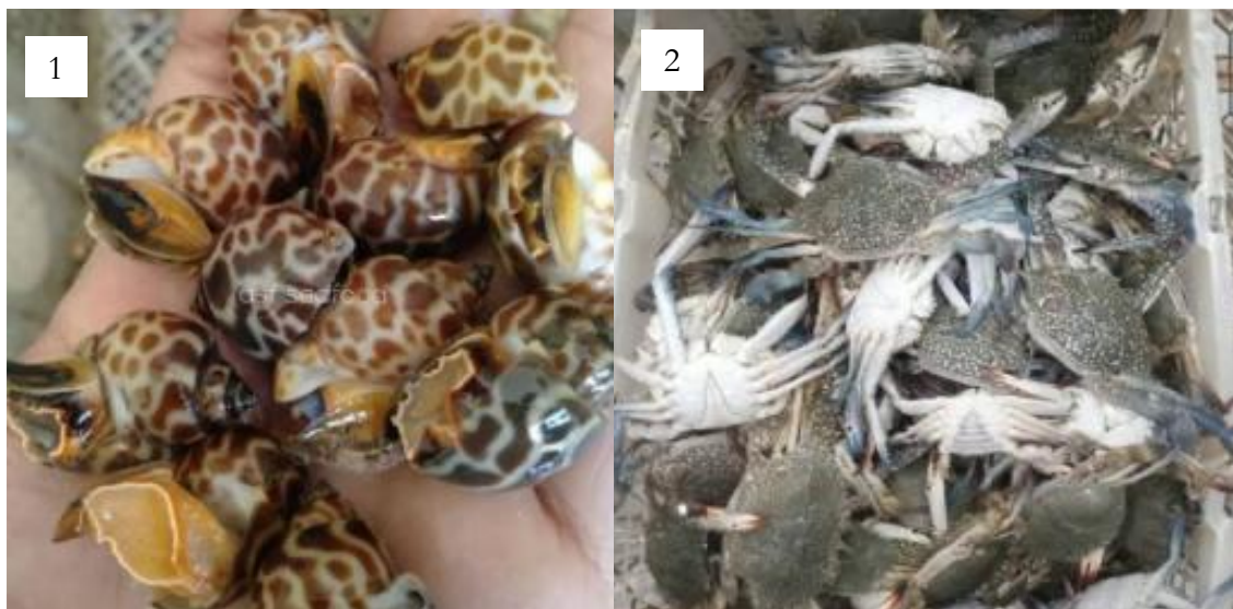
Gambar 3. Hasil tangkapan bubu: (1) Keong Macan ( Babylonia spirata ); (2) Rajungan ( Portunus pelagicus ).

tangkapan sampingan. Iskandar (2020) menyebutkan bahwa penangkapan kepiting bakau di desa Mayangan sekarang banyak menggunakan bubu karena dinilai lebih efisien dan ekonomis. Hasil tangkapan Keong Macan dan Rajungan dijual dengan harga kisaran Rp 13.000-Rp 15.000.