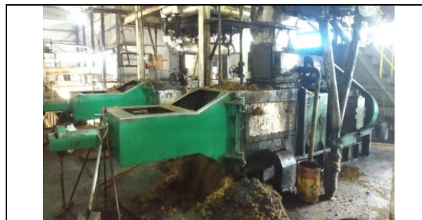
Gambar 1. Mesin Screw Press

Jadi penulis berupaya menganalisa beberapa tekanan terhadap screw press membandingkan tekanan hidrolik yang berperan selaku penahan screw press. Screw press alat yang harus digunakan memisahkan minyak kotor dari daging sawit yang sudah terjadi pelumasan. Fungsi dari screw press ialah memeras brondolan yang di cincang, dihancurkan atau di halukan dari digester untuk mendapat minyak. Mesin terdiri 2 batang besi campuran yang spiral ( screw ) dengan susunan horizontal dan berputar berlawanan arah. Buah dihancurkan didorong dan ditekan oleh cone , sehingga daging buah menjadi terperas. Dalam proses pemadatan buah yang sudah di hancurkan diperas dan di padatkan seluruh arah dan menemukan dengan stel alur hidrolik. Putaran screw diteruskan untuk membawa ampas keluar dari perasan menuju ke Breacker conveyer untuk di lanjutkan ke proses berikutnya. Perlengkapan hidrolik yang digunakan tipe adjusting cone yang menekan permukaan press sehingga buah yang dilumatkan terhimpit. CPO fibried dan nut merupakan hasil dari pemadatan, tekanan adjusting cone 50 sampai 60 bar arusnya 35 sampai 40 ampere, ukuran tekan cone dapat mempengaruhi pemadatan.[3]