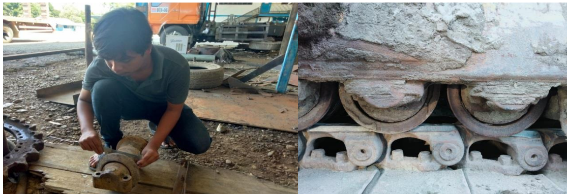
Gambar 2.1 Track roller dan Cara pengukuran