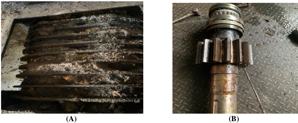
(A) (B) Gambar. 1 Jenis Kerusakan pada mesin kempa screw press A; Kerusakan/patah pada press cage , B; As penggerak pressan yang patah

dan perbaikan mesin kempa ( screw press ). Untuk lebih jelasnya jenis jenis kerusakan disajikan dalam gambar 1 sebagai berikut :