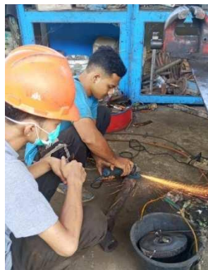
Gambar 16. proses penggerindaan universal joint

contoh penyesuaian jika alat masih bisa diperbaiki bentuknya adalah sebagai berikut :