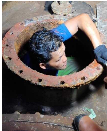
Gambar 11. Manhole Debris Filter telah dibuka

Sebelum membuka baut biasanya tim pemelihara menyemprotkan wd ke baut dan mur dengan tujuan mempermudah proses pembukaan baut.