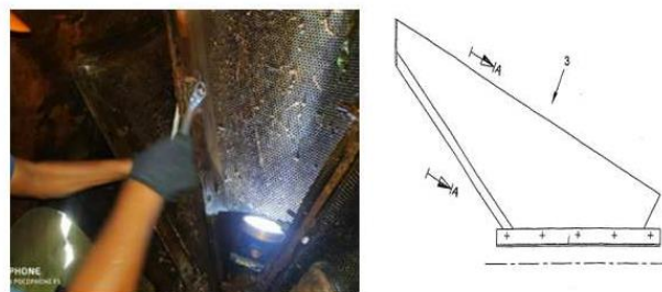
Gambar 12. proses cleaning strainer debris filter

Proses pembersihan dilakukan untuk mengambil sampah-sampah yang masih tertinggal di bagian filter, setelah pembersihan selesai lalu salah satu filter akan dibuka agar tim pemelihara dapat masuk ke dalam untuk membongkar bearing gear debris, universal joint dan connecting gear box.