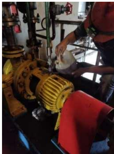
Gambar 8. preventive maintenance

Pemeliharaan preventif merupakan pemeliharaan yang dilakukan secara teratur untuk menghindari kerusakan tak terduga di masa depan. Sederhananya, ini tentang memperbaiki sesuatu sebelum rusak. Pemeliharaan preventif biasanya dilakukan inspeksi, perbaikan kecil, pelumasan dan penyetelan, sehingga unit mesin yang beroperasi terhindar dari kerusakan yang mengakibatkan penghentian operasi unit dan terus meningkatkan efisiensi unit serta menjaga unit terus bekerja secara normal tanpa ada gangguan [8].