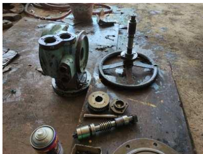
Gambar 9. Korektif maintenance