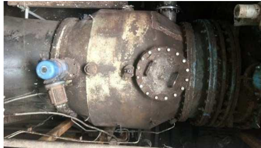
Gambar 17. Unit Debris Filter selesai pemasangan

baut, pengencangan baut secara berbalas agar kerapatan maksimal (pengencangan dengan membentuk angka tambah) sisi kiri dibalas kanan, dan sisi depan dibalas belakang. Dengan proses pengencangan baut yang sama (berbalas) ketika menutup manhole, proses ini juga yang menjadi akhir dari proses pembongkaran dan pemasangan kembali unit Debris Filter WFH - 1400