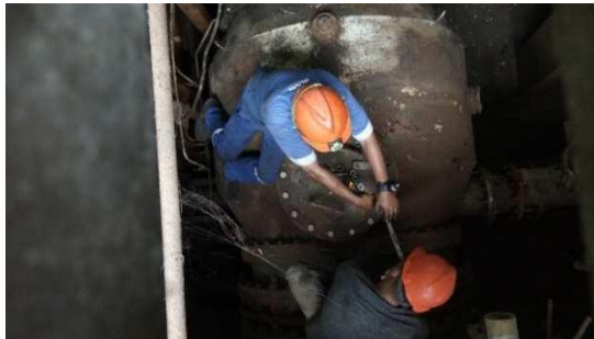
Gambar 10. Pembukaan Manhole Debris Filter

Proses ini dilakukan menggunakan bantuan mesin impact dan dua kunci.