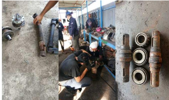
Gambar 15. proses pembongkaran setiap bagian