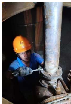
Gambar 14. proses pembukaan bearing gear

Setelah proses pembukaan dan cleaning strainer dilakukan, dilanjutkan dengan pembukaan bearing gear. dalam proses pemeliharaan pergantian gear bearing dilakukan secara rutin, rusak atau tidaknya suatu alat wajib diganti untuk mencegah kerusakan alat ketika unit sedang berjalan.