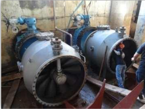
Gambar 2. Tampak Dalam Debris model WFH – 1400