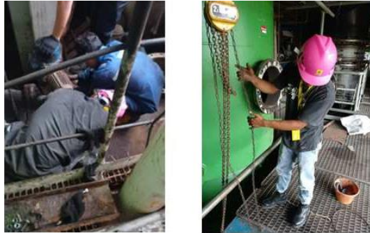
Gambar 13. Pelepasan connecting Gear Box

Setelah pelepasan strainer dilakukan maka akan dilanjutkan dengan melepas bearing yang ada pada jalur connecting gear box. sebelum pengambilan poros dan bearing sebelumnya harus dilakukan pembongkaran connecting gear box terlebih dahulu yang berada sejajar di atasnya. Berikut adalah gambar proses melepas connecting gear box dan pengangkatan menggunakan chain block dilakukan :