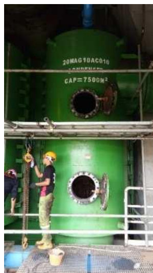
Gambar 1. kondensor N7500

Kondensor adalah alat yang memiliki fungsi untuk mengubah uap menjadi air. Kondensor memiliki prinsip kerja di mana proses perubahan dilakukan lewat cara mengalirkan uap ke suatu unit yang selanjutnya air tersebut kembali ke furnace untuk diproses kembali menjadi uap kering [6].