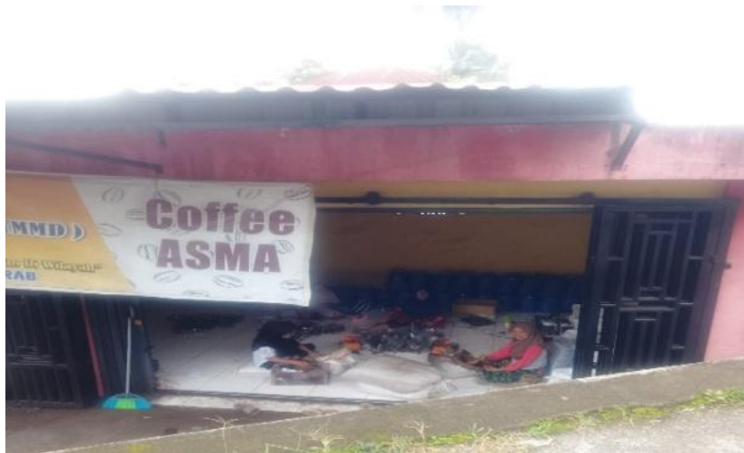
Gambar 4.1 Salah Satu UMKM Produksi Kopi di Nagari Koto Tuo yang Melibatkan Perempuan dalam Proses Pengolahan Kopi Bubuk

Pernyataan informan di atas menggambarkan adanya konstruksi sosial yang kuat bahwa pengolahan kopi merupakan domain perempuan. Proses perendangan yang membutuhkan keterampilan teknis tinggi dalam mengontrol suhu dan waktu penyangraian dikuasai hampir seluruhnya oleh perempuan. Keterampilan ini tidak hanya bersifat teknis, tetapi juga menyimpan dimensi estetis dan kultural yang diwariskan secara lisan dari generasi ke generasi.