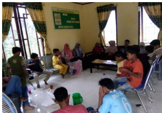
Gambar 2. Kegiatan Sosialisasi Bahaya Narkoba

Dibawah ini disajikan Gambar 2 saat tim melaksanakan kegiatan sosialisasi bahaya narkoba dan memetakan potensi-potensi remaja untuk kemudian diarahkan kepada berpikir kreatif, produktif dan inovatif.