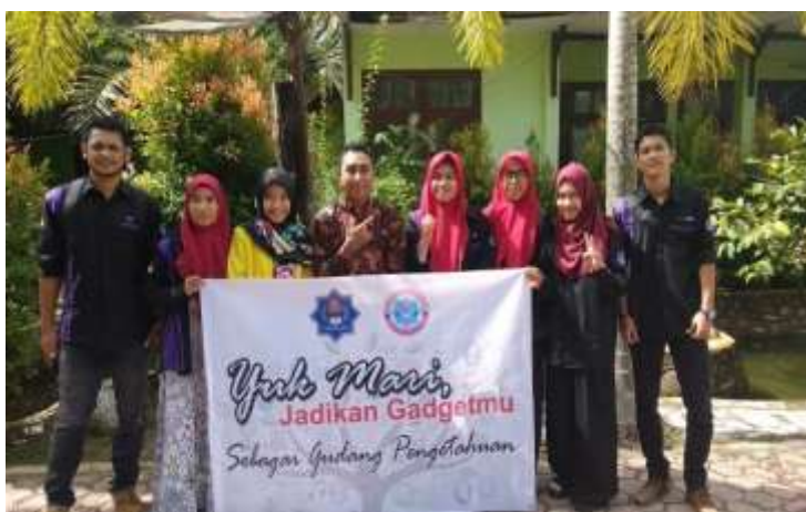
Gambar 4. Foto bersama tim mahasiswa Fakultas Kesehatan Masyarakat UTU