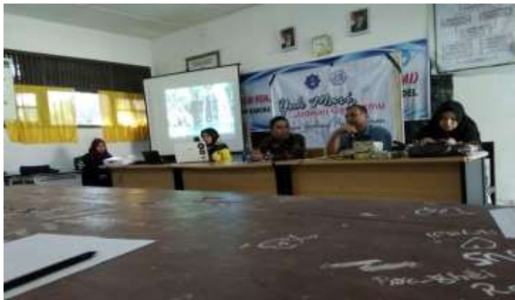
Gambar 2. Sosialisasi dan diskusi dengan para guru dan siswa tentang dampak penggunaan gadget pada remaja