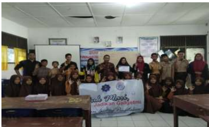
Gambar 3. Pemberian penghargaan kepada pihak Sekolah dan foto Bersama peserta