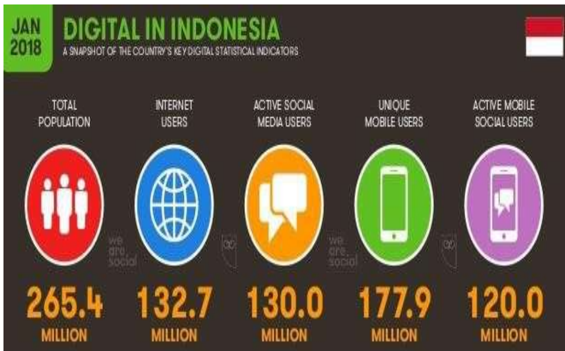
Gambar 1. Data Infogarfis di Indonesia

Pengguna gadget di Indonesia semakin tumbuh dengan pesat, bahkan diproyeksikan bahwa jumlah penetrasi gadget di Indonesia akan melampaui jumlah orang Indonesia (Rahmah, 2015). Indonesia merupakan negara keempat terpadat di dunia yang mencapai 260 juta jiwa, tentunya menjadi pasar teknologi digital yang besar (Kusyanti & Prastanti, 2017) (Pratama, 2018). Lembaga riset digital marketing emarketer memprediksi pada tahun 2018