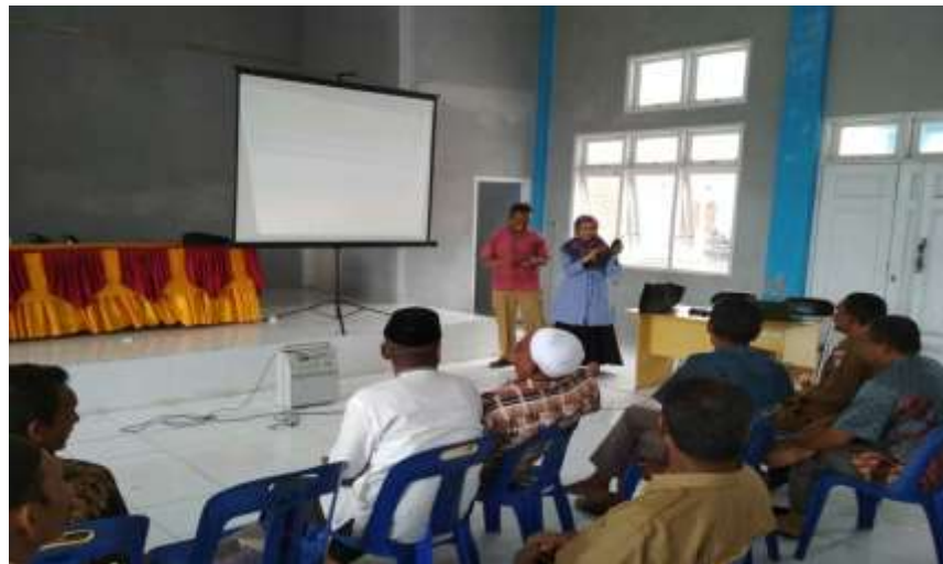
Gambar 2. Praktik Digital Marketing kepada Peserta Pada Saat Sosialisasi