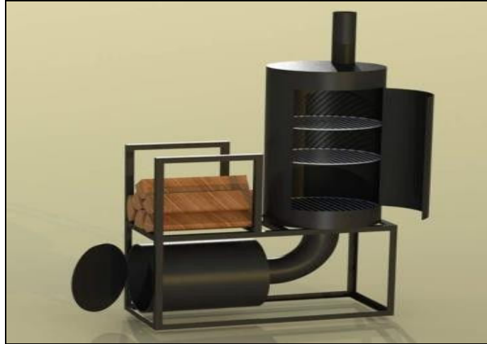
Gambar 3. Rangkaian Mesin Pengasapan Ikan

Seperti pada Gambar 3, mesin pengasapan ikan terbuat dari dua buah drum dan menggunakan bahan/material kayu/batok atau material yang mudah terbakar untuk menimbulkan asap. Mesin ini dapat digunakan untuk pengasapan ikan tawar, laut atau sungai. Bagian cerobong asap dapat diarahkan ke dalam air/sungai agar tidak mencemari udara.