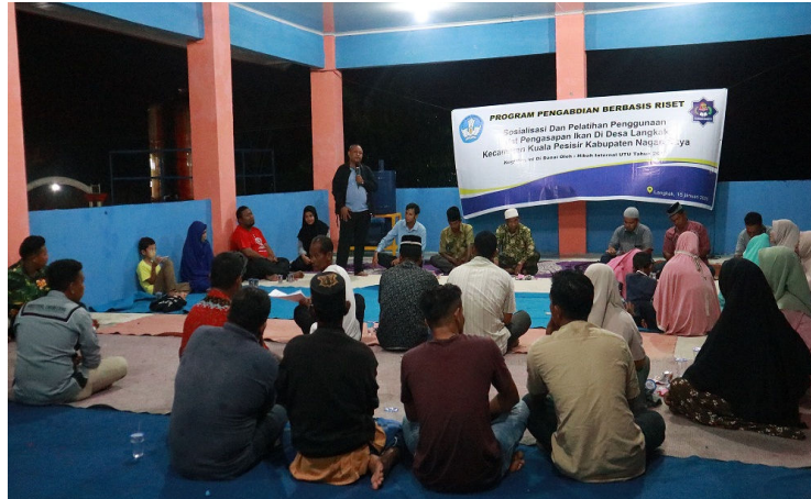
Gambar 4. Kegiatan Sosialisasi

nelayan Desa Langkak. Kegiatan sosialisasi dapat dilihat pada gambar 4.