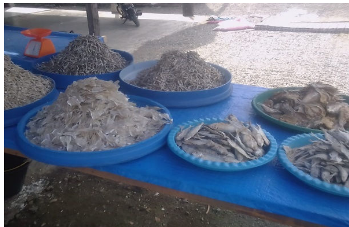
Gambar 2. Ikan Asin di Lokasi

Dari pemantauan sekitar Desa Langkak, beberapa jenis ikan tangkapan nelayan setempat merupakan ikan konsumsi seperti Lele, Gabus, Nila, Bandeng, Cakalang, Tongkol Komo, Tongkol Krai, Tuna Sirip Kuning, Kambing-Kambing, Layang, Lisong, Selar, Siro dan Sungkir. Ikan-ikan hasil tangkapan tersebut oleh nelayan tersebut dikeringkan secara alami dengan proses penggaraman dan bantuan sinar matahari dan hasilnya dapat dilihat pada Gambar 2.