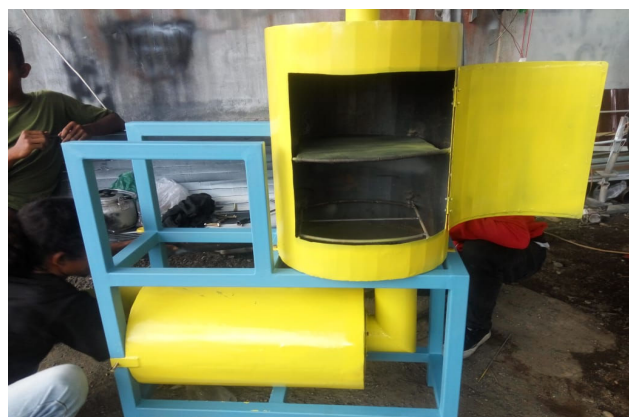
Gambar 5. Mesin Pengasapan Ikan

hollow yang kokoh sehingga dapat menahan drum serta bahan baku lainnya saat sedang pengasapan serta juga dapat mempunyai daya tahan yang baik. Material atau bahan baku pengasapan akan menggunakan kayu karena mudah terbakar dan menimbulkan asap yang relatif dan aman untuk kesehatan.