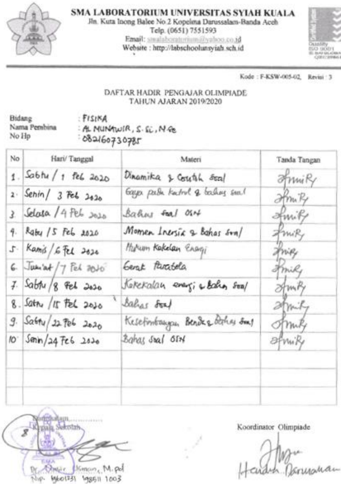
Gambar 3. Jadwal Pendampingan olimpiade

untuk menyelesaikan permasalahan soal secara mandiri. Di akhir setiap pertemuan diberikan kuis kecil agar siswa menjadi lebih paham dengan materi tersebut.