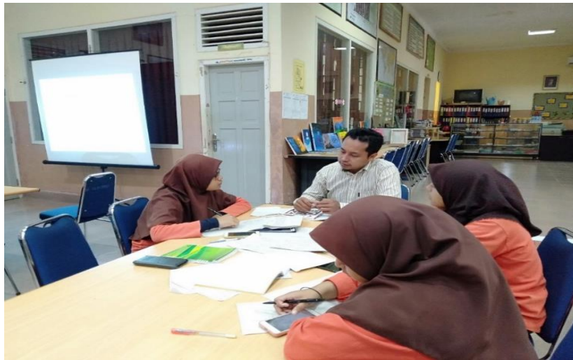
Gambar 4. Pelaksanaan Kegiatan

Kegiatan ini dilakukan oleh Dosen Teknik Mesin Universitas Teuku Umar. Kegiatan pembinaan dan pendampingan dilakukan oleh dosen pada setiap jadwal pengabdian. Selain itu, guru kelas