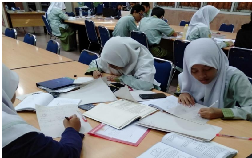
Gambar 1. Siswa Sedang Mengerjakan Soal

siswa untuk meningkatkan kemampuan nalar siswa dalam mendalami materi dan dalam menyelesaikan soal-soal Fisika di Olimpiade.