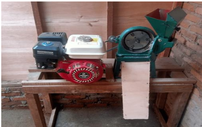
Gambar 2. Alat Penggiling Biji-Bijian

Tahap selanjutnya dilakukan pengujian alat mesin penggiling biji-bijian di lokasi mitra untuk melihat apakah berfungsi sesuai dengan yang direncanakan serta untuk melihat kekurangan alat pada saat digunakan agar dapat diperbaiki. Pada tahap ini juga digali informasi peralatan tambahan yang dibutuhkan sehingga mesin penggiling biji-bijian dapat bekerja maksimal. Bentuk dari alat penggiling biji-bijian dapat dilihat pada Gambar 2 di bawah ini.