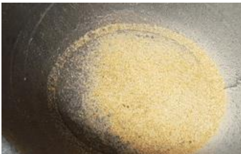
Gambar 4. Hasil Penggilingan Jagung