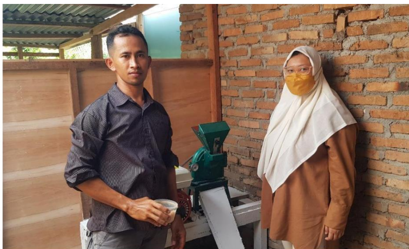
Gambar 3. Penyerahan Mesin Penggiling Biji-Bijian

Mesin penggiling biji-bijian digunakan untuk menghaluskan jagung. Jagung yang dihaluskan digunakan sebagai pakan ternak unggas (ayam kub dan entok). Hasil penggilingan jagung dengan mesin penggiling biji-bijian dapat dilihat pada Gambar 4.