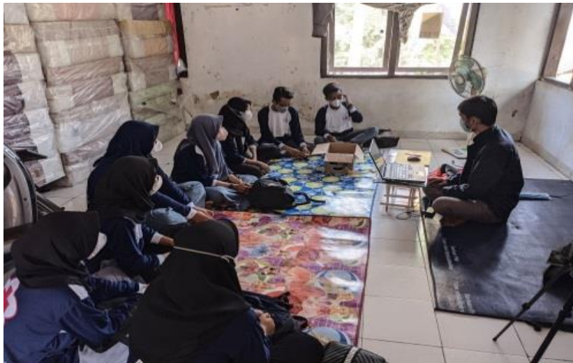
Gambar 2: Peserta Pendampingan Ms. Office

powerpoint ini agar peserta didik dapat membuat presentasi yang menarik dari tugas mereka. Presentasi yang menarik menumbuhkan minat belajar peserta didik meningkat (Resky, 2014). Kegiatan pengabdian ini melakukan pendampingan kepada 12 peserta didik mulai dari mengenalkan sampai pengoperasian microsoft office , kegiatan terlihat pada gambar 2: