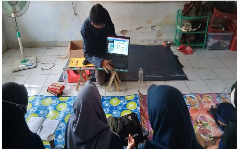
Gambar 3: Kegiatan Pengenalan Microsoft Office

Setelah tim pengabdian mendemonstrasikan kepada peserta pendampingan, tahap selanjutnya dilakukan bimbingan kepada