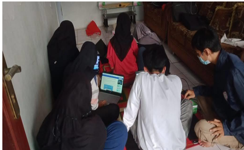
Gambar 4: Praktek Pengoperasian Ms. Office

peserta pendampingan secara praktek. Hal ini dapat terlihat pada gambar 4 dan 5: