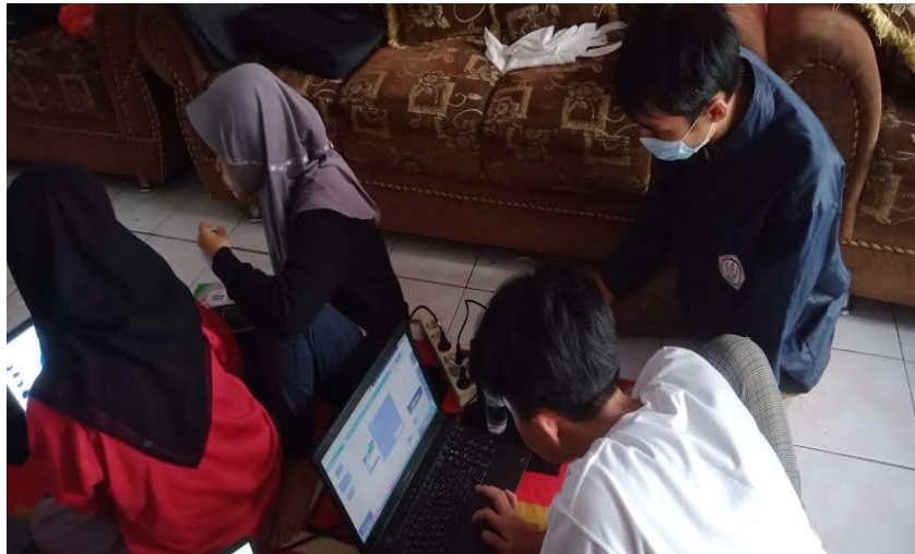
Gambar 5: Bentuk Pelaksanaan Pendampingan Ms. Office

Peserta didik tampak antusias terhadap pendampingan yang dilaksanakan. Dilihat dari keaktifan, peserta didik bertanya saat praktik. Hasil dari pendampingan ini terjadi peningkatan kemampuan dalam mengoperasikan microsoft office . Hal ini terlihat dari peserta didik yang sudah bisa membuat makalah menggunakan microsoft word , membuat presentasi di microsoft power point , dan dapat mengolah angka sederhana di microsoft excel .