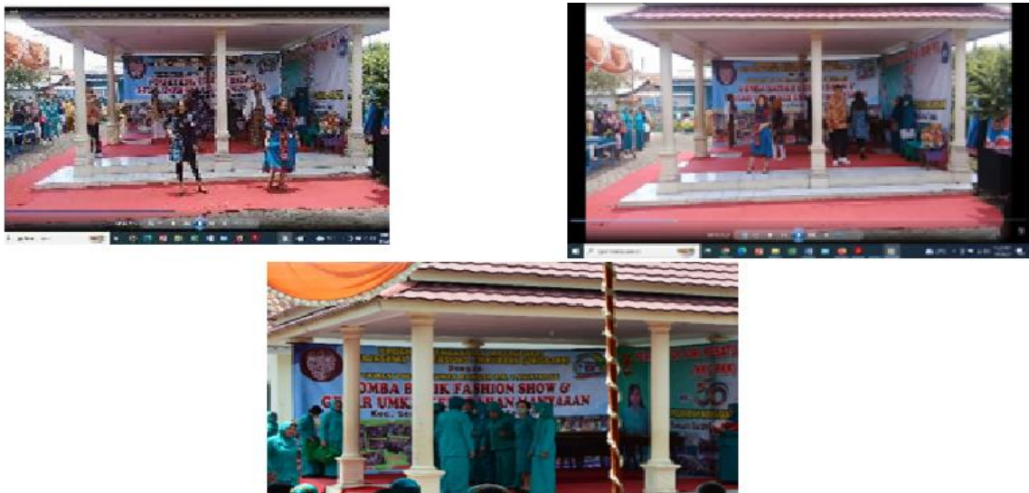
Gambar 3. Gelar Kreativitas dengan Lomba Fashion Show Batik

bisa terukur dengan kegiatan-kegiatan degan inisiasi dari tim pengabdian dengan mempersiapkan UMKM yang akan didampingi berkaitan dengan produk dan fasilitasi dalam bentuk tempat display untuk bisa pameran produk-produknya menambah ketrampilan dan kreativitas dan wawasan baru bagi mitra terutama bagi mitra penggerak PKK dalam melakukan pendampingan dan pemberdayaan masyarakat terutama UMKM. Hal itu dilakukan sebagai upaya dalam persiapan hari Kesatuan Gerak PKK bagi ibu-ibu PKK di wilayah Kelurahan Kembangarum dengan kegiatan yang dipusatkan di taman pintar “tunas bangsa”. Kegiatan ditunjukkan pada gambar 3 dan 4.