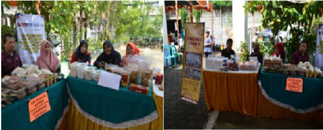
Gambar 4. Gambar Display Produk UMKM