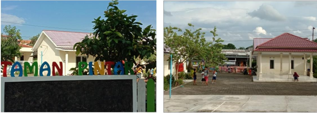
Gambar 1. Gambar Taman Pintar “Tunas Bangsa”

Taman Pintar “Tunas Bangsa” merupakan satu tempat atau wadah tempat berkumpulnya sekelompok masyarakat yang bertujuan untuk mengeksplorasi berbagai pengetahuan yang bisa diterapkan bagi kelompok remaja, anak-anak, PAUD, Kelompok Usaha Bersama (Kube), kader PKK, kader Posyandu, termasuk RT dan RW yang ada di lingkungan taman pintar. Kegiatan di taman pintar disesuaikan dengan kebutuhan kelompok masyarakat sasaran, dengan fasilitasi yang ada saat ini belum optimal, pendampingan dan