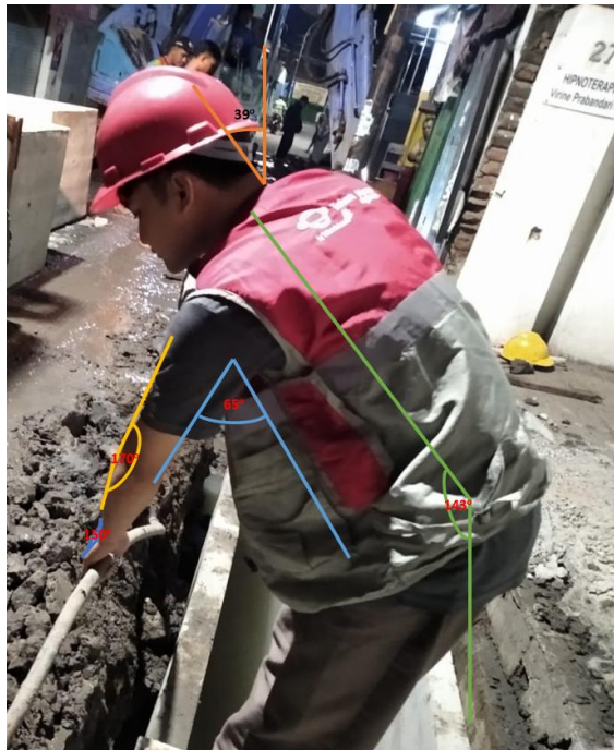
Gambar 2. Proses Merapikan Kabel Tanah