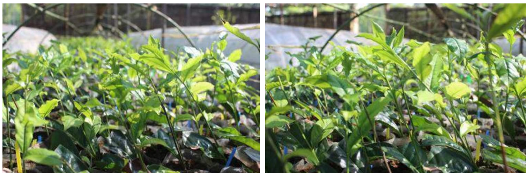
Gambar 2. Bibit hasil aplikasi biofertilizer

Pecah pucuk ditandai dengan munculnya pucuk peko (pucuk aktif) pada bibit yang diberi perlakuan biofertilizer. Keberadaan pucuk peko atau pucuk aktif menunjukkan pertumbuhan bibit yang baik, ditandai dengan rata-rata tinggi tanaman, jumlah daun dan kehijauan daun yang tinggi. Pada tanaman teh terjadi periodisitas pucuk, yaitu pergantian periode pucuk burung menjadi peko atau sebaliknya. Periodisitas pucuk peko dan burung merupakan siklus yang harus dilewati oleh tanaman teh. Pematangan dormansi ketika terjadi periode pucuk burung dapat dilakukan dengan pemupukan, pemberian