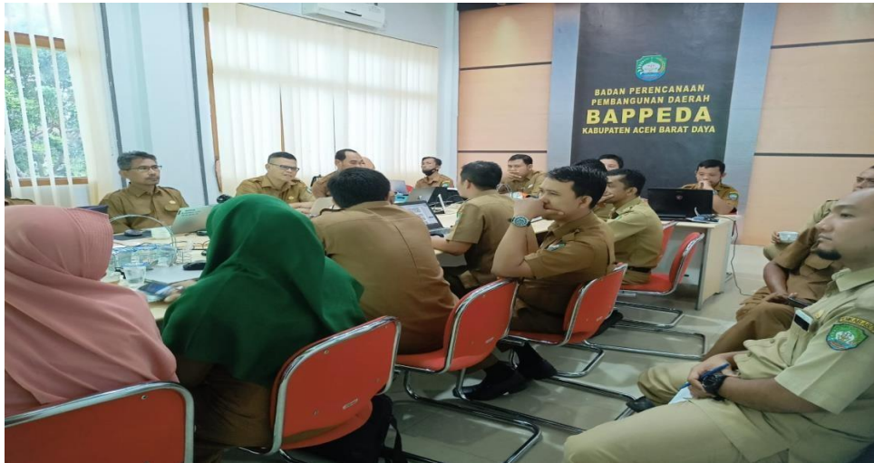
Gambar 1. Aparatur dalam memperbaiki semangat kerja staf.