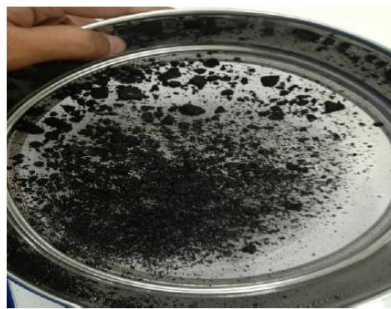
Gambar 1 Bahan baku hasil pengayakan

Bahan baku arang tempurung kelapa dan kayu kaliandra digiling dan dilakukan pengayakan berukuran 30 mesh. Proses pengayakan bahan baku ditunjukkan pada Gambar 1.