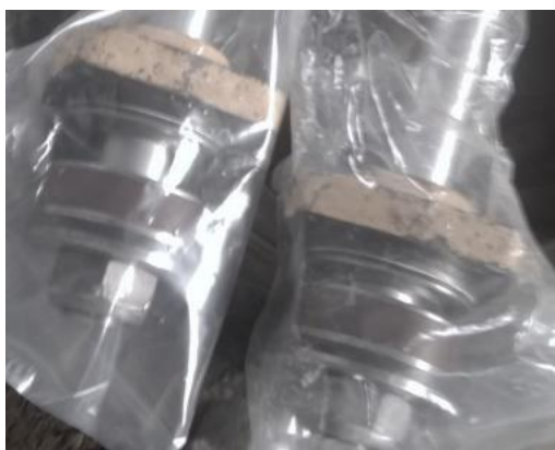
Gambar 2.3 Piston

Bentuk dari piston hidrolik adalah pendek dan mempunyai alur. Alur mempunyai tujuan sebagai dudukan seal yang sudah disesuaikan alurnya Sering terdapat tonjolan pada piston yang berakibat kebocoran serta goresan didalam silinder, hal ini berdampak pada kinerja apabila terdapat kerusakan pada seal sehingga dinding silinder dan piston saling bergesekan yang berdampak silinder terkikis [8,9].