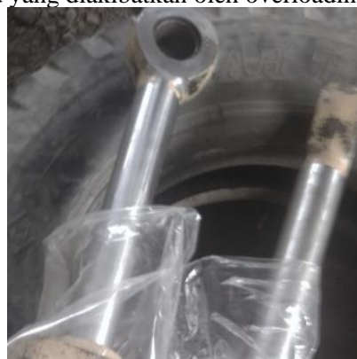
Gambar 2.2 Rod Piston