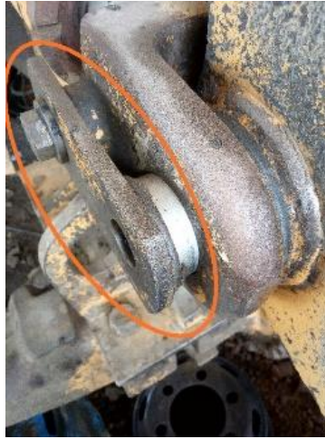
Gambar 3.2 Pin

Keausan yang tidak merata pada pin membuat lengan bergerak lambat. Pin ini digunakan untuk menyambungkan arm dengan hydraulic lift cylinder dan menguncinya sehingga saat hydraulic lift cylinder bergerak naik turun, arm bergerak tanpa jatuh. Kerusakan pin biasanya karena kurangnya perawatan. Pin putus, diduga karena kelelahan akibat beban siklik yang terjadi pada pin. Beban merupakan kombinasi dari beban angkat, tekuk dan kejut (shock) yang dialami oleh pin pada saat wheel loader dibebani [10].