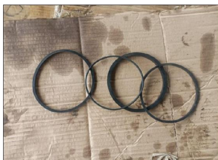
Gambar 3.1. Seal

Ada beberapa hal yang menjadi pemicu seal rusak diantaranya massa dari tersebut seal tersebut sehingga mengalami kerapuhan dan kehausan pada seal tersebut yang di picu oleh zat cair( hydraulic oil ) dimana didalam oli tersebut terdapat kotoran, serta panas yang ditimbulkan dari oli ketika beroperasi [5].