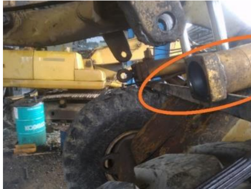
Gambar 2.1 Silinder Barel