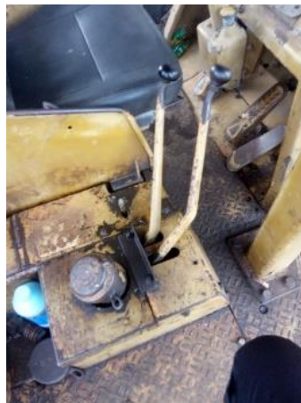
Gambar.3.3 Joy stick

Penyumbatan saluran oli karena kotoran dan air akan menyebabkan pilot nozzle tidak bekerja. Pilot nozzle atau joystick adalah alat yang digunakan untuk mengontrol atau memainkan gerakan naik turun silinder bucket dan stick yang berbentuk tuas. Penyumbatan karena kotoran menghalangi pilot injector atau tuas bekerja secara optimal, mencegah silinder pengangkat hidrolik bergerak.