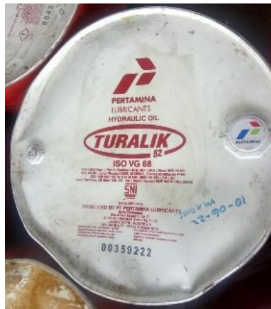
Gambar 3.5. Hydraulic Oil

Saat mengganti part di atas, penulis mengacu pada manual loader bengkel Caterpillar 950, karena dalam pengerjaannya, ada beberapa poin penting yang harus diperhatikan dan tidak boleh terlewatkan. Ganti komponen silinder pengangkat hidraulik, lakukan proses perakitan silinder pengangkat hidraulik, dan setelah mengganti komponen dan rakitan, lakukan uji coba unit.