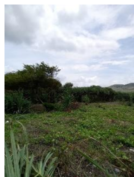
Gambar 6. Titik 4