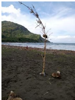
Gambar 3. Titik 1

Pada percobaan ini menggunakan beberapa titik yaitu 5 titik acuan untuk mendapatkan data kecepatan angin yang ada di pesisir pantai, sehingga dapat mengetahui perbedaan kecepatan yang terjadi disetiap titik penelitian. Berikut ini merupakan gambaran titik penelitian yang dapat dilihat pada gambar sebagai berikut: