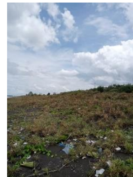
Gambar 5. Titik 3