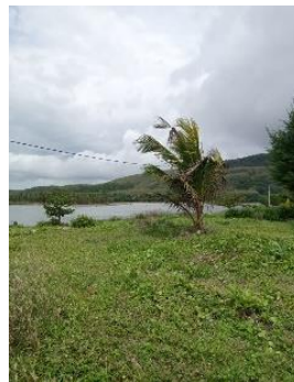
Gambar 4. Titik 2