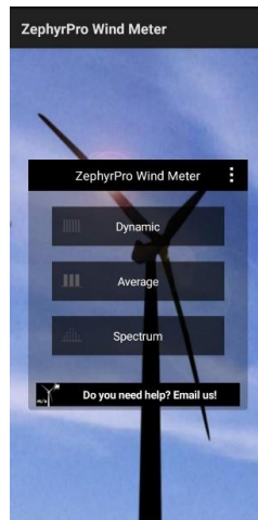
Gambar 2. Tampilan Aplikasi ZephyrPro Wind Meter

Penelitian ini menggunakan alat ZephyrPro Wind Meter untuk mengukur kecepatan angin yang bekerja menggunakan sensor . Berikut Tampilan dari aplikasi yang digunakan dalam penelitian.