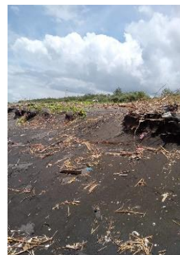
Gambar 7. Titik 5