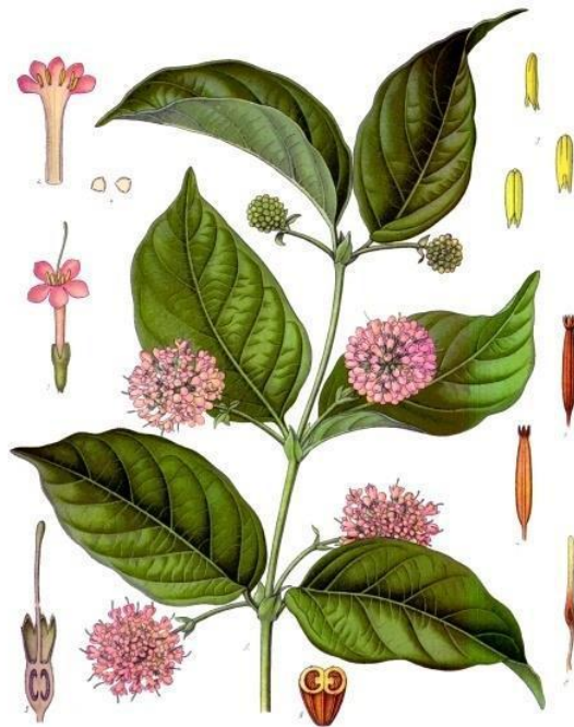
Gambar 1. Tanaman Gambir ( Uncaria gambir Roxb) [3]

gambir adalah bunga majemuk, berbentuk lonceng, terletak di ketiak daun, panjang lebih kurang 5 cm, memiliki mahkota sebanyak 5 helai yang berbentuk lonjong, dan berwarna ungu. Buahnya berbentuk bulat telur, panjang lebih kurang 1,5cm dan berwarna hitam. Tanaman gambir dapat tumbuh pada ketinggian bervariasi antara 2-500 m dari permukaan laut dan memerlukan cahaya matahari yang banyak dan merata sepanjang tahun [2].