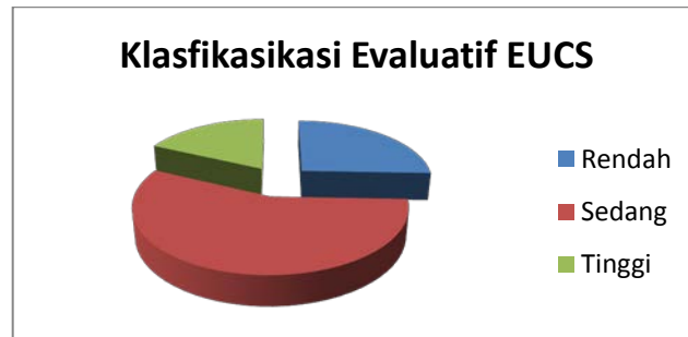
Gambar 2. Klasifikasi Evaluatif EUCS

Klasifikasi evaluatif dari keenam variabel diperlihatkan pada gambar 3, menunjukkan bahwa dari perspektif pengguna, tingkat kepuasan karyawan terhadap sistem informasi sebesar 25,6% masih rendah, sedangkan 56,4% memiliki kepuasan sedang dan sisanya sebesar 18% menunjukkan kepuasan tinggi.