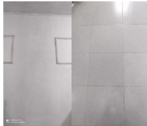
Gambar 4. Kondisi dinding dan lantai

dapat mengubah keadaan suhu udara yang panas menjadi udara yang bersuhu dingin sehingga ruangan menjadi lebih nyaman dan dapat mempertahankan mutu bahan pangan yang ada di ruang pengolahan. Badrin et al (2019) menyatakan bahwa suhu dingin dapat menghambat pertumbuhan bakteri penyebab kemunduran mutu udang karena tidak tersedianya lingkungan yang cocok untuk aktivitas bakteri. Selain itu, penggunaan fasilitas pencegah hama atau pest sangat penting dalam industri pangan. Hama atau binatang pengganggu merupakan salah satu sumber utama pencemar yang sangat berbahaya bagi produk pangan. Sistem pengendalian hama dilakukan untuk menjamin bahwa tidak ada hama pada ruang pengolahan pangan dan mengurangi populasi hama di lingkungan pengolahan sehingga tidak menyebabkan kontaminasi pada produk (Sandra dan Juhairiyah, 2015).