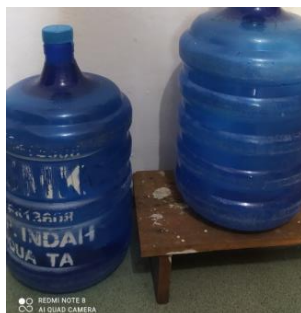
Gambar 2. Sumber air yang digunakan

Proses pengolahan bakso udang di KUB. Rizki Sabena, tidak menggunakan es dalam proses produksinya dan hanya menggunakan air saja. Air yang dipakai berupa air minum isi ulang dan PDAM. Air PDAM digunakan untuk pencucian peralatan, pencucian pertama bahan baku dan bahan pangan, pembersihan ruang produksi dan lainnya. Air minum isi ulang digunakan sebagai air cucian terakhir, perebusan bakso dan campuran langsung pada bahan pangan. Air tersebut juga telah memenuhi standar berdasarkan Peraturan Menteri Kesehatan Republik Indonesia Nomor 32 Tahun 2017 yang telah dijelaskan bahwa standar air untuk keperluan sanitasi dan hygiene adalah air yang tidak keruh, tidak berbau dan tidak memiliki rasa.