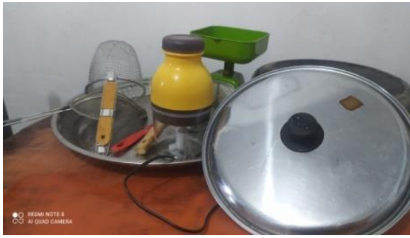
Gambar 3. Alat produksi yang digunakan