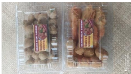
Gambar 5. Kemasan bakso

Label dikemas bakso udang KUB. Rizki Sabena berupa stiker kertas dan keterangan pada label tidak lengkap. Berdasarkan Peraturan Kepala Badan Pengawas Obat dan Makanan Republik Indonesia Nomor 12 Tahun 2016 pencantuman label pada kemasan pangan olahan ditulis atau dicetak dengan menggunakan Bahasa Indonesia serta memuat paling sedikit keterangan mengenai nama produk, daftar bahan yang digunakan, berat bersih atau isi bersih, nama dan alamat pihak yang memproduksi atau mengimpor, halal bagi yang dipersyaratkan, tanggal dan kode produksi, tanggal, bulan, dan tahun kedaluwarsa, nomor izin edar serta asal usul bahan pangan tertentu.