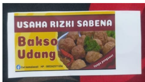
Gambar 6. Label bakso

Label dikemas bakso udang KUB. Rizki Sabena berupa stiker kertas dan keterangan pada label tidak lengkap. Berdasarkan Peraturan Kepala Badan Pengawas Obat dan Makanan Republik Indonesia Nomor 12 Tahun 2016 pencantuman label pada kemasan pangan olahan ditulis atau dicetak dengan menggunakan Bahasa Indonesia serta memuat paling sedikit keterangan mengenai nama produk, daftar bahan yang digunakan, berat bersih atau isi bersih, nama dan alamat pihak yang memproduksi atau mengimpor, halal bagi yang dipersyaratkan, tanggal dan kode produksi, tanggal, bulan, dan tahun kedaluwarsa, nomor izin edar serta asal usul bahan pangan tertentu.