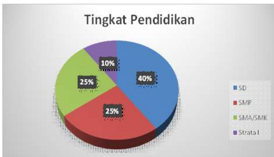
Gambar 3. Komposisi tingkat pendidikan responden nelayan di Teupah Selatan dan Teluk Dalam