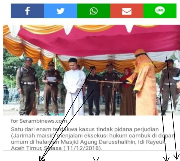
Foto Pelaksanaan Hukum Cambuk Terhadap Terdakwa Kasus Tindak Pidana Perjudian di Halaman Masjid Agung Darusshalihin, Idi Rayeuk, Aceh Timur pada hari Selasa, 11 Desember 2018

Dalam foto tersebut juga terlihat adanya aparat penegak hukum seperti polisi, ini menandakan kegiatan pencambukan tersebut sah menurut hukum dan dilindungi oleh negara. Adapun kesimpulannya yaitu seorang algojo dalam foto tersebut terlihat menggunakan pakaian yang serba tertutup dengan maksud agar identitasnya tidak diketahui oleh siapapun dan proses pencambukan tersebut sah menurut hukum juga dilindungi oleh aparat negara.