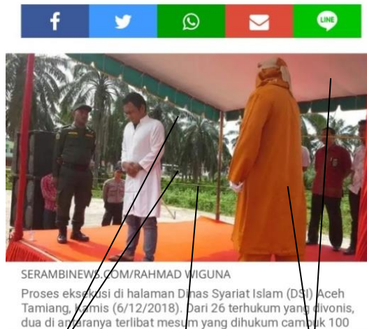
Foto Pelaksanaan Hukum Cambuk di Halaman Dinas Syariat Islam Aceh Tamiang Pada Hari Kamis, 6 Desember 2018