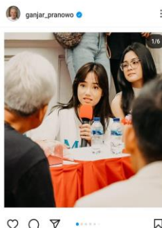
Gambar 1.3 Unggahan Gambar Ganjar Pranowo Ketika Bertemu dan Berdiskusi Dengan Para Influencer Dari Berbagai Daerah

Ganjar pun kerap mengunggah kegiatan yang dilakukan bersama dengan anak muda menciptakan image yang menyenangkan dan interaktif. Pada unggahan foto 15 Agustus 2023, Ganjar menyampaikan bahwa ia telah berdiskusi banyak hal salah satunya terkait kecemasan anak muda hingga potensi besar pada bidang industri kreatif. Ini menunjukkan bahwa Ganjar menampilkan diri sebagai sosok yang mau mendengarkan pendapat-pendapat anak muda, menunjukkan Ganjar sebagai sosok pemimpin yang berpikiran terbuka dan berbeda dari pemimpin yang lain. Ini menjadi salah satu bentuk strategi Ganjar mendekati Generasi Z.