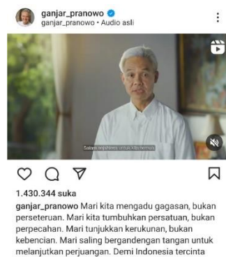
Gambar 1.2 Unggahan Video Ganjar Pranowo Menyampaikan Pesan Kepada Rakyat

Tidak hanya menunjukkan sisi nya yang sederhana dan merakyat. Ganjar Pranowo juga menegaskan pada postingan video yang diunggah pada 12 September 2023, bahwa Ganjar merupakan sosok tegas dan tidak tutup mata dengan keadaan dan permasalahan yang sedang dihadapi Indonesia. Dalam video tersebut Ganjar menyampaikan kepada masyarakat bahwa pentingnya persatuan dan kerukunan antar sesama dalam melaksanakan kontestasi Pemilu. Melalui unggahan ini Ganjar menyampaikan prinsipnya dalam memimpin yang berlandaskan pada keberanian, kejujuran, ketaatan, kesantunan, pantang menyerah, kasih sayang, kepedulian, menghargai sesama, dan juga ketulusan.