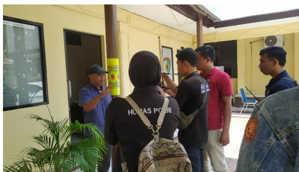
Gambar 5. Humas Polresta Mataram Memperoleh Informasi Dari Sumber Terpercaya

Pernyataan dari hasil wawancara di atas terkait dengan memperoleh informasi melalui sumber-sumber terpercaya agar informasi tersebut sesuai dengan kebenaran dapat dilihat pada gambar di bawah ini.