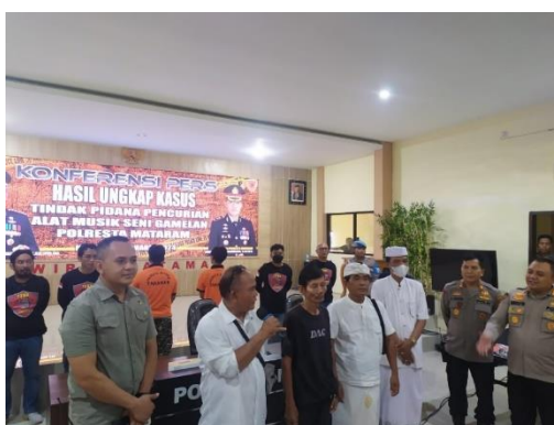
Gambar 7. Konferensi Pers Hasil Ungkap Kasus

Pernyataan dari IPEW terkait dengan konferensi pers dapat dilihat melalui gambar di bawah ini.