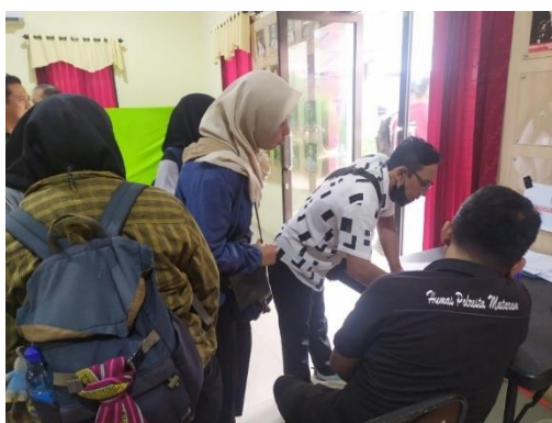
Gambar 6. Pertemuan Ramah Tamah Humas Polresta Mataram Dengan Awak Media

“Program dengan kemitraan kadang-kadang kita mengadakan pertemuan ramah tamah kepada awak media melalui analisis evaluasi, itu kita mempunyai program melihat agenda setting melalui kalender kamtibmas atau ada kegiatan besar yang sifatnya kegiatan pemerintah yang harus disampaikan kepada publik atau masyarakat. Dalam pelatihan ini bidang kehumasan dibantu oleh pihak media untuk bisa membantu meningkatkan keterampilan bagi personil polri khususnya di polresta mataram.”