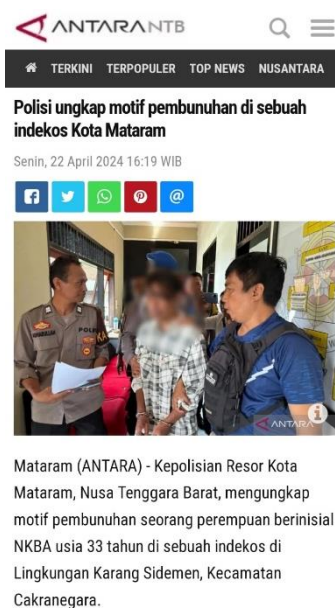
Gambar 3. Pemberitaan Hukrim Melalui Media Online

Penyampaian informasi positif merupakan salah satu strategi Humas Polresta Mataram sebagai upaya membangun kepercayaan masyarakat terhadap institusi kepolisian. Menyampaikan informasi merupakan tugas utama Humas Polresta Mataram dengan didasari pada undang-undang dan peraturan yang berlaku. Penyampaian informasi ini dilakukan dengan memberikan informasi yang bersifat transparan, terbuka, akurat, dan sesuai dengan kebenaran. Melalui pengamatan peneliti, Humas Polresta Mataram menyampaikan informasi secara transparan dan terbuka mengenai kelanjutan-kelanjutan kasus hukum kriminal. Informasi tersebut disampaikan kepada masyarakat melalui media massa. Informasi yang bersifat transparan, terbuka, akurat, dan sesuai dengan kebenaran penting untuk disampaikan kepada masyarakat agar mengetahui kelanjutan dari kasus-kasus tersebut.