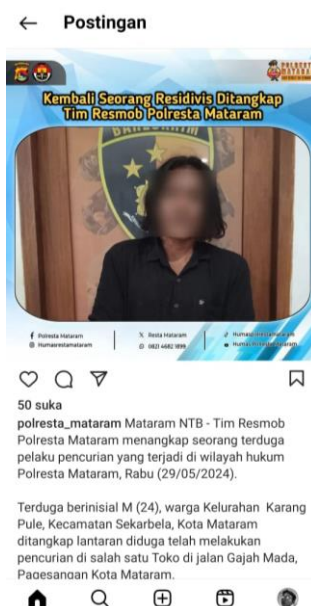
Gambar 4. Informasi Hukrim Melalui Media Sosial Instagram Polresta Mataram

Saat menyampaikan informasi yang bersifat positif, Humas Polresta Mataram selalu melakukan verifikasi atau mengkonfirmasi informasi yang diterima dengan tujuan agar informasi tersebut sesuai kebenaran dan terpercaya. Pada saat observasi, peneliti melihat bahwa Humas Polresta Mataram melakukan koordinasi dengan pihak-pihak yang memiliki wewenang dalam memberikan informasi. Hal ini dilakukan dengan tujuan untuk menghindari informasi-informasi yang tidak sesuai dengan kebenaran. Pihak berwenang tersebut termasuk Kapolresta Mataram atau pejabat lain yang bertugas dalam suatu kegiatan. Namun, khusus untuk informasi terkait hukum dan kriminal dilakukan secara bertahap karena adanya proses penyelidikan dan penyidikan. Jika informasi bersifat seremonial dapat diberikan secara langsung pada saat itu juga.