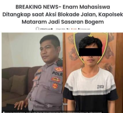
Gambar 1. Pemberitaan Counter Opini Melalui Media Online

Pernyataan dari IPEW selaku Kepala Sub Seksi Penerangan Masyarakat dapat dilihat pada gambar di bawah ini.