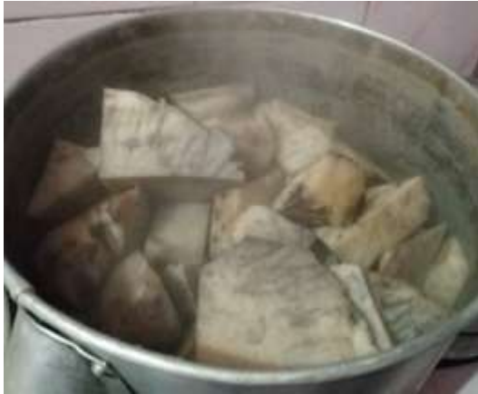
Gambar 1. Bonggol pisang yang dikukus

ukuran ± 10 x 20 cm, dicuci bersih, lalu dikukus selama 1 jam. Kemudian bonggol didinginkan selama 30 menit pada suhu ruang dan dihaluskan menggunakan mesin penggiling bumbu dengan menambahkan air dalam perbandingan 2:1 (bonggol pisang : air).