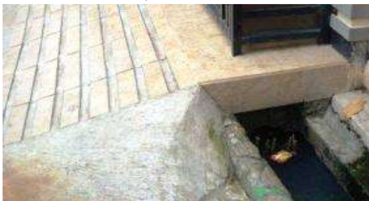
Gambar 2. Kondisi Saluran Air

Industri rumah tangga Libby Brownies menjalankan produksinya dalam bangunan rumah satu lantai dengan luas kurang lebih sekitar 270 m. Bangunan pabrik UMKM Libby Brownies dilengkapi dengan ventilasi yang cukup untuk keluar masuk udara. Dalam satu bangunan terbagi menjadi ruangan-ruangan yang memiliki desain, konstruksi, dan tata ruang sesuai dengan kepentingan produksinya masing-masing, seperti ruang penyimpanan bahan baku yang tertutup, ruang pemanggangan yang luas dan terbuka, serta ruang produksi kue dan makanan pencuci