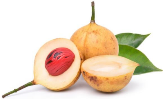
Gambar 1. Buah Pala

pertumbuhan bakteri berbahaya (Rumopa et al. , 2016). Zat antibakteri mempunyai berbagai cara dalam menghambat pertumbuhan bakteri yakni dengan merusak salah satu struktur penyusun sel bakteri sehingga menyebabkan perubahan-perubahan struktur dan kerja bakteri. Hal ini dapat mengakibatkan kematian sel (Husna, 2007).