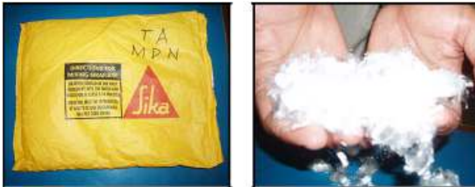
Gambar 1. Serat Polypropylene