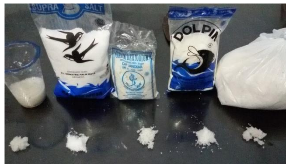
Gambar 2. Perbandingan garam produksi pabrikan dan produksi Kecamatan Samatiga

Data tersebut menunjukkan bahwa peningkatan harga garam pasca impor meningkat. Hal ini berdampak bagi penjual dan pengolah ikan asin, dimana garam merupakan bahan baku utama dalam membuat ikan asin. Harga garam yang tinggi, akan membuat perekonomian di Samatiga akan melemah. Dengan adanya program produksi garam di Samatiga, diharapkan akan membantu dan meningkatkan perekonomian di Samatiga serta membantu dalam pemahaman ilmu dan teknologi khususnya dalam membuat garam. Dengan adanya sentral garam di Samatiga, akan membantu pembuat ikan asin, dimana selain harga yang murah juga masyarakat samatiga akan mampu membuat garam sendiri.