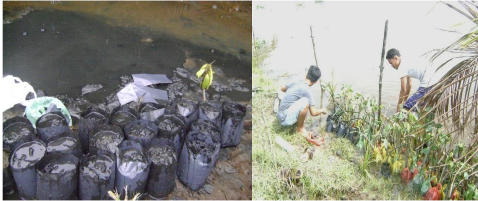
Gambar 1. Penyemaian Bibit mangrove di Desa Kuala Bubon