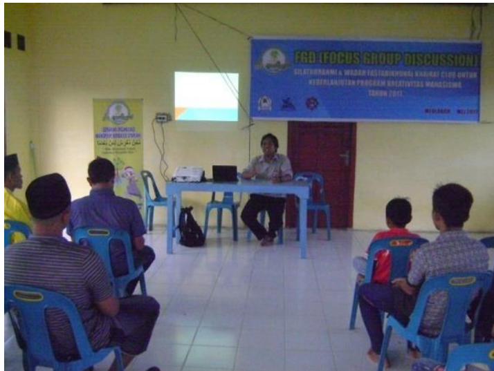
Gambar 5. Kegiatan Penyuluhan

tokoh pemuda dan tokoh agama. Kegiatan tersebut diharapkan member dampak positif bagi masyarakat Pesisir (Gambar 3).