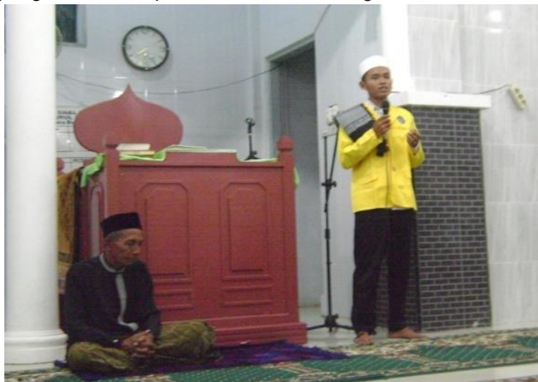
Gambar 2. Dakwah di Masjid Nurul Iman Kuala Bubon

Kami melakukan Dakwah/ceramah tentang lingkungan pesisir khususnya ekosistem mangrove di Masjid Nurul Iman Desa Kuala Bubon yang dimulai setelah shalat magrib. Konteks dakwah berkaitan hubungan manusia dengan Sang Pencipta (Allah SWT), hubungan sesama manusia, dan Hubungan dengan alam khususnya hutan mangrove. Menurut kami, metode ini sangat efektif untuk kegiatan sosialisasi melalui kegiatan dakwah kepada masyarakat sehingga memiliki pengetahuan dan pemahaman yang baik terkait pelestarian hutan mangrove.