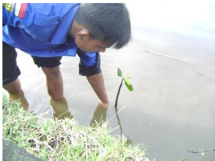
Gambar 6. Penanaman Mangrove di kawasan Kuala Bubon

Aksi penanaman bibit mangrove dilakukan bersama masyarakat pesisir Desa Kuala Bubon. Penanaman bibit dimulai pada sore hari sesuai dengan hasil musyawarah masyarakat pesisir dimana pada sore hari mereka sudah selesai melakukan pekerjaan rutinitas. Jumlah bibit mangrove yang kami tanam bersama masyarakat sebanyak 300 batang. Aksi penanaman mangrove dilakukan pada sore hari dikarenakan perairan tersebut mengalami pasang surut pada sore hari itu jadi sangat cocok untuk dilakukan penanaman mangrove dengan masyarakat lokal.