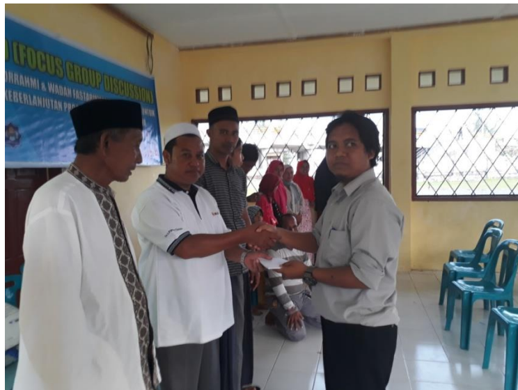
Gambar 7. Pemberian sedekah jariah kepada DKM Mesjid Nurul Iman

Telah nampak kerusakan di darat dan di laut disebabkan karena perbuatan manusia, supaya Allah merasakan kepada mereka sebahagian dari (akibat) perbuatan mereka, agar mereka kembali (ke jalan yang benar) (Surah Ar-Rum : 41).