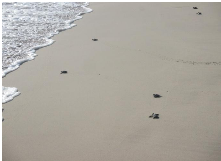
Gambar 6. Tukik penyu menuju kelaut

Prinsip pelepasan tukik yang dilakukan disini adalah pelepasan tukik secepat – cepatnya dan bersamaan, begitu mereka menetas lalu muncul ke permukaan tanah/pasir, maka tukik-tukik tersebut harus segera dilepaskan ke laut agar insting alam dan cadangan makanan cukup untuk menempuh perjalanan yang dirasakan aman menurut tukik-tukik tersebut (WWF, 2009).