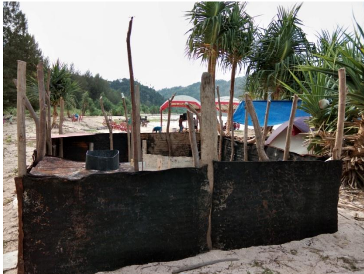
Gambar 3. Tempat penangkaran penyu alami

Telur-telur penyu yang berada di tempat penangkaran berasal dari pantai setempat yang direlokasi oleh kelompok LEPA. Telur-telur tersebut telah dikemas menggunakan ember dan siap di tanam kembali di lokasi penangkaran dengan ukuran kedalaman yang sama seperti yang alami.