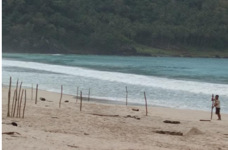
Gambar 4. Batasan pada saat pelepasan Tukik Penyu

Pelepasan tukik dilaksanakan pada hari minggu tanggal 11 Maret 2018. Acara ceremony pelepasan dilaksanakan serentak untuk kedua sarang mengingat ini adalah pengalaman pertama dan juga antusias masyarakat untuk menyaksikan pelepasan sangatlah tinggi. Pelepasan di mulai pukul 17.00 Wib, mengingat aktifitas predator laut sudah mulai berkurang sehingga persentase keselamatan tukik-tukik yang dilepaskan lebih tinggi.