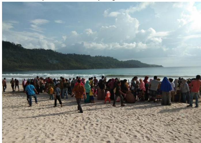
Gambar 5. Antusias peserta melakukan pelepasan tukik

Pelepasan tukik dilakukan secara simbolis oleh Direktur KKHL-PRL-KKP Pusat, Kepala DKP Kabupaten Aceh Besar, Sekda Bupati Aceh Besar dan juga perwakilan mahasiswa Unsyiah Fakultas Kelautan dan Perikanan, Fakultas Kedokteran Hewan, dan Fakultas MIPA, serta masyarakat umum yang berdomisili di Pulo Aceh.