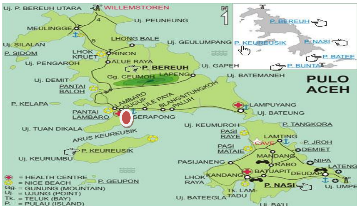
Gambar 1. Peta lokasi Kegiatan Pengabdian Sumber : (WCS-Marine, 2017).

Teknik pendekatan yang digunakan terhadap persoalan mitra adalah metode ceramah dan praktikum. Metode ceramah dilakukan dengan cara memberikan penyuluhan secara langsung kepada kelompok Lembaga Ekowisata Pulo Aceh (LEPA) dan masyarakat sekitar Pulo Aceh tentang konservasi penyu, agar dapat menumbuhkan kesadaran masyarakat pesisir untuk mempertahankan populasi penyu di Aceh.