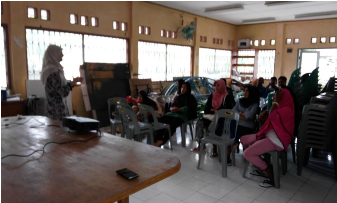
Gambar 4. Diskusi

Meskipun masyarakat diundang dalam beberapa rapat perencanaan, partisipasi yang dilakukan oleh masyarakat pada tahap ini tergolong semu. Benefit yang diperoleh dari bentuk partisipasi yang dilakukan tidak menunjukkan hasil yang signifikan, bahkan umpan balik yang disampaikan oleh masyarakat lokal atas keputusan yang diambil oleh penguasa sering diabaikan. Padahal substansi dalam pengembangan Gampong wisata berbasis masyarakat, partisipasi yang dilakukan oleh masyarakat Suak Indrapuri seharusnya bersifat aktif dan langsung. Namun, selalu dihadang oleh keputusan penguasa yang bersifat topdown.