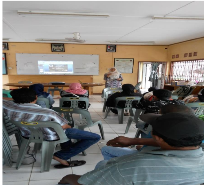
Gambar 3. Memberikan Paparan