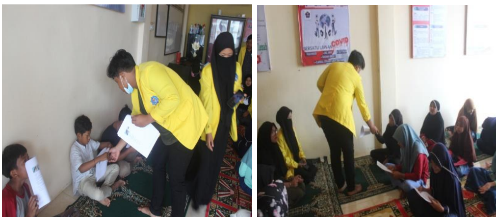
Gambar 3. Pemberian pre-test dan pos-test

Sebelum dilakukannya kampanye diketahui tingkat pengetahuan anak yang baik sebanyak 50% yang baik dan 50% yang kurang. Sedangkan setelah dilakukannya kampanye terjadi perubahan tingkat pengetahuan anak meningkat 100% yang baik dan 0% yang kurang. Dari hasil tersebut diketahui bahwa pemberian kampanye pendidikan gizi gemar makan ikan pada usia 12-15 tahun sangat bermanfaat terhadap pengetahuan anak dalam pencegahan stunting melalui mengonsumsi ikan. Kegiatan pre-test dan pos-test dapat dilihat pada gambar 3.