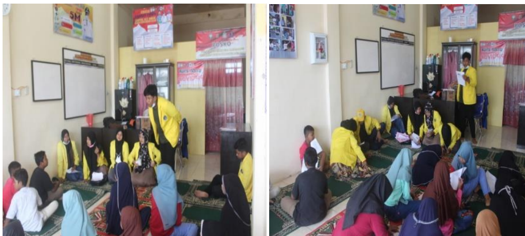
Gambar 2. Kampanye GEMARIKAN

Kegiatan kampanye GEMARIKAN dilakukan pada anak usia 12- 15 tahun. Kegiatan kampanye ini diawali dengan pemaparan tentang, jenis-jenis ikan, kandungan gizi pada ikan, agar anak-anak dapat mengetahui manfaat makan ikan. Karena ikan memiliki peran penting sebagai sumber energi, protein dan variasi nutrisi esensial yang menyumbang sekitar 20% dari total protein hewan (Nailis dan Pratiwi, 2017) yang dapat berpengaruh dalam pencegahan stunting. Kegiatan ini mendapat dukungan penuh dari aparat desa dan rekan satu desa, mulai dari persiapan hingga pelaksanaannya. Secara keseluruhan kegiatan berjalan dengan lancar dan dipenuhi dengan antusiasme dari para peserta. Hal ini karena kegiatan ini belum pernah dilaksanakan di desa Alue Ambang sebelumnya. Kegiatan ini dapat dilihat pada gambar 2.