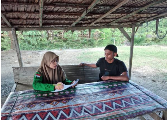
Gambar 3. Wawancara warga setempat

Muganda et al. (2013) menyebutkan masyarakat lokal tidak dapat diabaikan keberadaannya karena perannya yang krusial dalam pengembangan ekowisata.