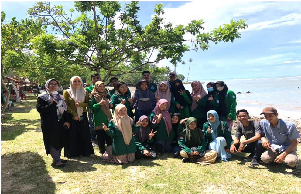
Gambar 5. Pantai Lhok Bubon (Februari 2022)

Ditinjau dari sisi wisatawan, persepsi positif yang dimiliki wisatawan menunjukkan bahwa wisatawan memiliki kepedulian dan kesadaran yang tinggi terhadap ekologi. Sedangkan dari sisi Pemerintah, persepsi Pemerintah terhadap ekologi cukup baik. Hal ini dibuktikan dengan adanya produk-produk kebijakan yang berpihak terhadap pengelolaan lingkungan. Dengan adanya dukungan teknis bagi masyarakat dalam bentuk pelatihan dan sarana pendukung. Hanya saja tidak dapat dipungkiri bahwa dorongan Pemerintah terhadap pelaku usaha agar terlibat dalam kegiatan pelestarian ekologi dirasakan kurang maksimal sehingga pelaku usaha tidak menempatkan hal ini sebagai kewajiban yang perlu ditindak lanjuti.