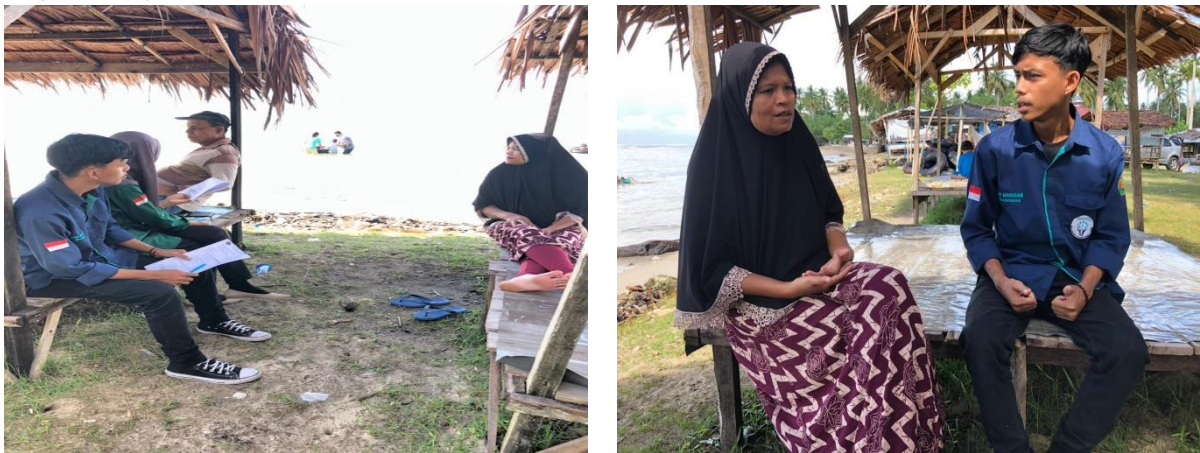
Gambar 2. Wawancara kepada pelaku usaha di pantai Lhok Bubon

Stern (2000) dalam hasil penelitiannya menyatakan bahwa terdapat tiga orientasi nilai yang mempengaruhi perilaku terhadap lingkungan, antara lain (1) nilai egoistic (nilai yang terfokus pada diri sendiri), (2) nilai altruistic (nilai yang memperhatikan kesejahteraan orang lain), (3) nilai biospheric (nilai yang menekankan pada lingkungan dan biospher). Beragamnya persepsi terhadap ekologi menunjukkan bahwa para pemangku kepentingan memiliki pemahaman dan kepentingan yang berbeda, dimana hal ini menjadi tantangan dalam pengembangan ekowisata yang berkelanjutan di pantai Lhok Bubon.