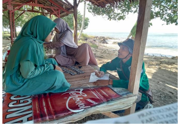
Gambar 4. Wawancara wisatawan

Ditinjau dari sisi wisatawan, persepsi positif yang dimiliki wisatawan menunjukkan bahwa wisatawan memiliki kepedulian dan kesadaran yang tinggi terhadap ekologi. Sedangkan dari sisi Pemerintah, persepsi Pemerintah terhadap ekologi cukup baik. Hal ini dibuktikan dengan adanya produk-produk kebijakan yang berpihak terhadap pengelolaan lingkungan. Dengan adanya dukungan teknis bagi masyarakat dalam bentuk pelatihan dan sarana pendukung. Hanya saja tidak dapat dipungkiri bahwa dorongan Pemerintah terhadap pelaku usaha agar terlibat dalam kegiatan pelestarian ekologi dirasakan kurang maksimal sehingga pelaku usaha tidak menempatkan hal ini sebagai kewajiban yang perlu ditindak lanjuti.