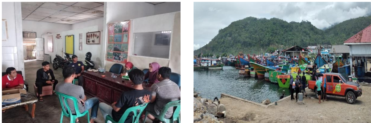
Gambar 2. Pelaksanaan Kegiatan Pengabdian di Pulau Seurudong

Aspek Lingkungan merupakan aspek penting dalam Sustainable Development Goals (SDGs). Menurut Rizky dan Mahsur (2022) menyatakan bahwa fokus dalam aspek ini adalah bukan berfokus kepada generasi sekarang, tetapi untuk generasi ke depannya. Disini perlu pendekatan secara langsung ke masyarakat dalam ruang lingkup wilayah maritim dan pulau-pulau kecil untuk merangkul bersama-sama. Adanya partisipasi dan dukungan masyarakat dan pemuda daerah agar dapat berintegrasi serta memperkuat komitmen semua pihak dalam menjaga potensi ekosistem perairan Indonesia. Dokumentasi selama kegiatan pengabdian ini (Gambar 2) dapat dilihat sebagai berikut: