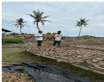
Proses observasi pengeringan