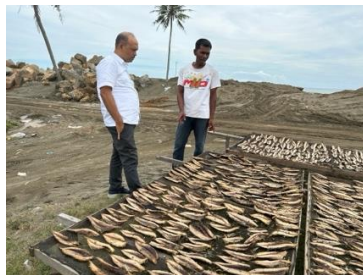
Sosialisasi pengeringan ikan kayu