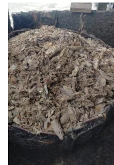
Pemisahan tulang ikan