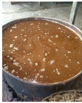
Proses perebusan dengan cuka