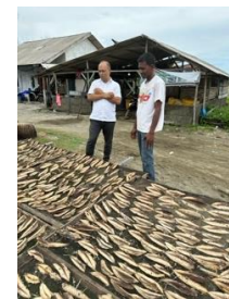
Proses diskusi pengeringan ikan kayu