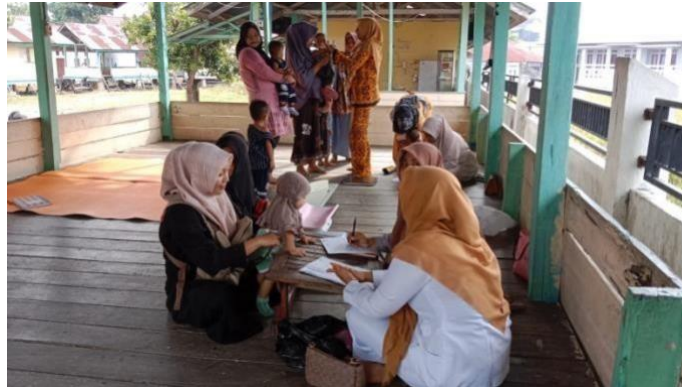
Gambar. 5 posyandu desa mesjid tuha

pertumbuhan dan perkembangan anak serta motorik anak menjadi baik. Banyak olahan yang bisa dibuat dari daun kelor, tapi pada kenyataannya sebagian masyarakat hanya tahu mengolah daun kelor sebagai sayur bening atau sayur sebagainya. Padahal banyak kreasi makanan yang bisa dibuat seperti, bolu daun kelor, bubur, puding dan masih banyak lagi. Tanaman daun kelor selain banyak manfaatnya juga mudah didapatkan di setiap desa. Kegiatan ini dilaksanakan pada saat posyandu di balai desa, dilihat dari antusias masyarakatnya yang cukup tinggi mampu menyukseskan kegiatan ini.