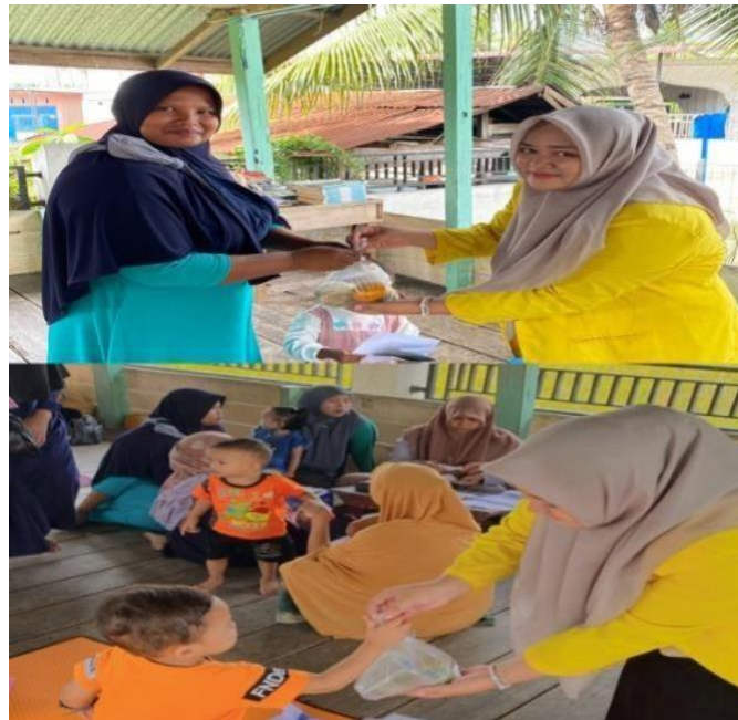
Gambar. 4 pembagian makanan tambahan

Edukasi atau sosialisasi dilaksanakan di balai desa mesjid tuha tepatnya di dayah alhijrah. Kegiatan pengabdian ini sejalan dengan jadwal posyandu di desa tersebut pada 09 Juni 2023. Dihadiri sekitaran 80 an lebih masyarakat baik ibu yang memiliki balita maupun ibu hamil. Dalam pelaksanaan kegiatan edukasi tim kelompok menampilkan slide ppt yang didalamnya terdapat materi mengenai apa itu stunting, pencegahan stunting dan terakhir bagaimana mengolah makanan tambahan dari bahan dasar yang ada di desa. Kegiatan edukasi ini merupakan suatu wadah untuk masyarakat mendapatkan pemahaman lebih terkait masalah-masalah kesehatan terutama stunting, stunting menjadi masalah penting bagi setiap orang ibu karena bersifat mengancam kelangsungan hidup tumbuh dan kembang anak. Melalui edukasi masyarakat lebih dapat menerima informasi dengan mudah.