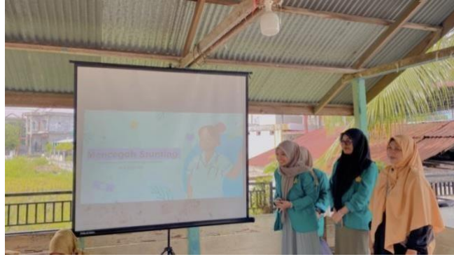
Gambar 3 edukasi terkait stunting dan pangan lokal

Edukasi atau sosialisasi dilaksanakan di balai desa mesjid tuha tepatnya di dayah alhijrah. Kegiatan pengabdian ini sejalan dengan jadwal posyandu di desa tersebut pada 09 Juni 2023. Dihadiri sekitaran 80 an lebih masyarakat baik ibu yang memiliki balita maupun ibu hamil. Dalam pelaksanaan kegiatan edukasi tim kelompok menampilkan slide ppt yang didalamnya terdapat materi mengenai apa itu stunting, pencegahan stunting dan terakhir bagaimana mengolah makanan tambahan dari bahan dasar yang ada di desa. Kegiatan edukasi ini merupakan suatu wadah untuk masyarakat mendapatkan pemahaman lebih terkait masalah-masalah kesehatan terutama stunting, stunting menjadi masalah penting bagi setiap orang ibu karena bersifat mengancam kelangsungan hidup tumbuh dan kembang anak. Melalui edukasi masyarakat lebih dapat menerima informasi dengan mudah.