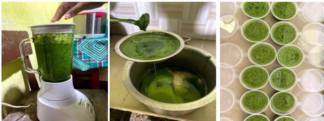
Gambar 2 proses pembuatan puding daun kelor

Pengabdian ini dilaksanakan oleh kelompok mahasiswa KKN. Kegiatan ini di berlangsung selama 1 jam. Dengan memberikan edukasi mengenai stunting dan pemberian makanan tambahan berupa puding daun kelor Sebelum memberikan makanan tambahan, diawali dengan edukasi terkait stunting dan pengelolaan makanan tambahan berbasis pangan lokal kepada Ibu-ibu dengan memberikan pertanyaan untuk melihat sejauh mana pemahaman Ibu-ibu terkait stunting dan PMT pangan lokal. Cara yang dilakukan melalui diskusi atau ceramah dengan menampilkan slide ppt kepada Ibuibu agar mereka paham bukan hanya mendengarkan tetapi bisa melihat langsung melalui ppt yang ditampilkan. Adapun tahapan atau proses pembuatan makanan tambahan ini yaitu dilakukan di rumah pak geuchik dengan bantuan kader posyandu. Sejumlah 80 an lebih puding yang akan dibuat untuk dibagikan kepada Ibu-ibu yang memiliki balita. Daun kelor merupakan tanaman yang mudah dijumpai di mana saja termasuk menjadi tanaman yang tumbuh banyak di desa mesjid tuha. Banyak kreasi yang bisa dibuat atau di olah dari pemanfaatan daun kelor. Contohnya puding SULOR (susu daun kelor) yang zat gizi di dalam nya sangat tinggi dan bagus untuk pertumbuhan anak-anak. Daun kelor ini juga mampu mencegah terjadinya stunting pada anak.