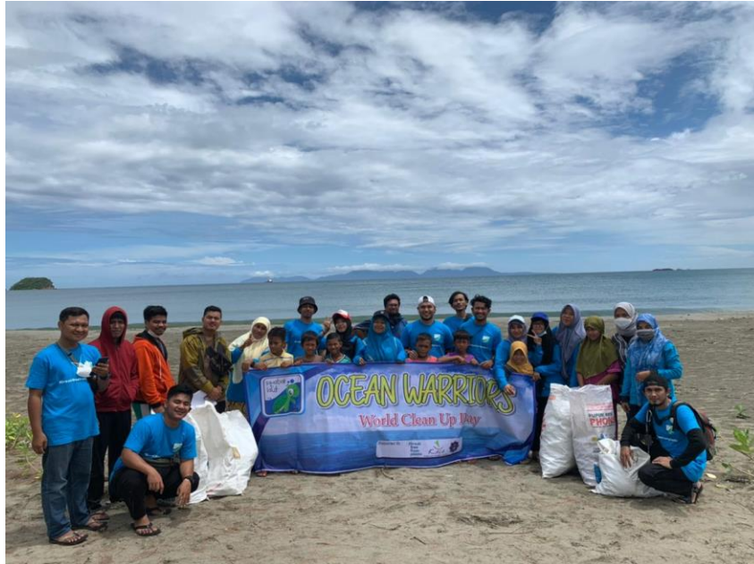
Gambar 7. Foto bersama tim kegiatan bersih sampah