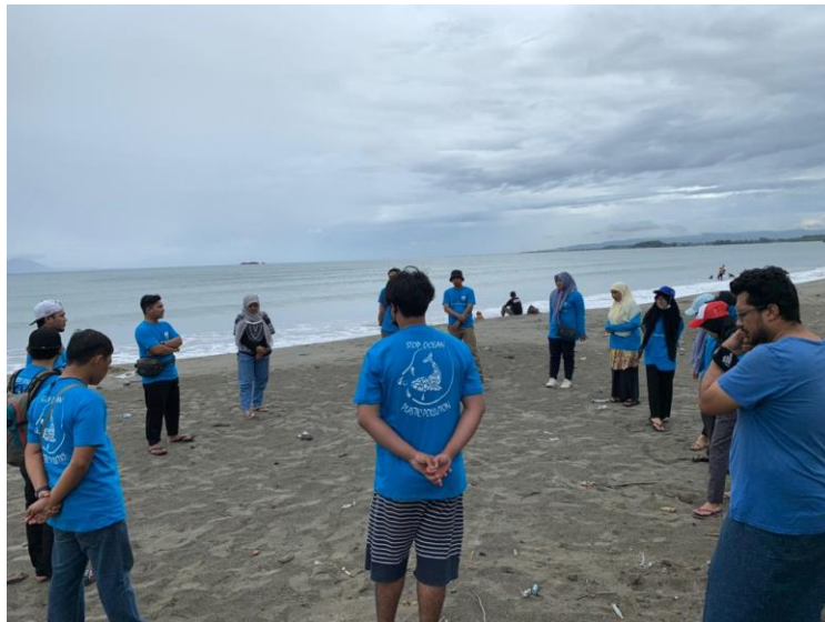
Gambar 2. Situasi saat edukasi tentang kebersihan pantai

Adapun beberapa pertanyaan yang ditanyakan oleh peserta dalam hal ini adalah: (1). mengapa plastik di laut berbahaya? Dari pertanyaan ini kemudian dapat dijelaskan bahwa sampah plastik yang tersebar dalam laut sangat berbahaya, yaitu: (a) Plastik yang ukurannya kecil dapat dimakan ikan, kemudian akan terakumulasi dalam tubuh ikan. Apabila ikan tersebut dikonsumsi manusia, maka plastik tersebut akan termakan manusia. Padahal plastik merupakan bahan yang membahayakan kesehatan bila termakan manusia atau hewan (b) Mengakibatkan kemiskinan manusia, terutama masyarakat pesisir pantai yang bekerja sebagai nelayan. Mengapa demikian, karena disamping berdampak pada perikanan. Banyak ikan mati, ikan yang tercemar, juga pada bidang perkapalan, dan pariwisata. Apabila banyak sampah plastik di laut maka akan menghambat pergerakan kapal. Apabila banyak sampah plastik di laut akan mengganggu keindahan pantai sehingga wisatawan akan menjadi kurang tertarik pada pantai yang tercemar tersebut.