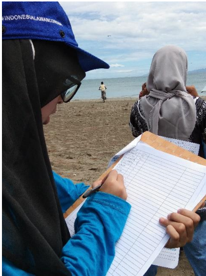
Gambar 5. Kegiatan Pencatatan sampah