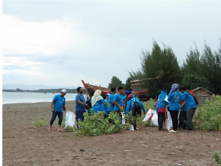
Gambar 3. Kegiatan pengutipan sampah

Selama proses pengutipan sampah berlangsung, peserta banyak menemukan berbagai jenis sampah plastik, botol plastik, kain, pipet plastik dan lain sebagainya. Peserta juga mengedukasikan kepada anak-anak nelayan setempat untuk tidak membuang alat tangkap berupa jaring ke daerah laut, karena akan berdampak kepada biota laut yang ada di perairan sekitar. Hal ini dapat dilihat dari gambar 4 berikut ini.