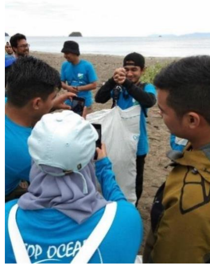
Gambar 6. Kegiatan Penimbangan sampah

Berdasarkan tabel 1 diatas, maka jenis sampah botol plastik paling banyak ditemukan. Sebanyak 500 botol plastik dari berbagai merek ditemukan di pantai Lamtengoh, dengan berat 51,1 kg yang paling mendominasi. Selanjutnya sampah plastik kresek dengan berat 6,3 kg dan plastik sachet 5,3 kg. Jenis sampah pipet/sedotan plastik juga masih banyak ditemui di pantai ini. Ada sebanyak 65 sedotan plastik yang berhasil dikutipkan pada saat kegiatan itu. Kategori sampah campuran juga tergolong banyak, dengan berat 6,8 kg. Hal ini menunjukkan bahwa di lokasi pantai Lamtengoh masih banyak masyarakat yang suka membuang sampah plastik sembarangan. Di lokasi pantai tersebut juga belum menyediakan tempat buang sampah yang khusus, sehingga banyak pengunjung dan masyarakat yang masih suka membuang sampah secara sembarangan.