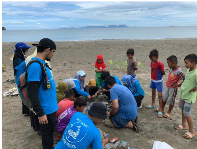
Gambar 4. Edukasi sampah bagi anak-anak nelayan

Selama proses pengutipan sampah berlangsung, peserta banyak menemukan berbagai jenis sampah plastik, botol plastik, kain, pipet plastik dan lain sebagainya. Peserta juga mengedukasikan kepada anak-anak nelayan setempat untuk tidak membuang alat tangkap berupa jaring ke daerah laut, karena akan berdampak kepada biota laut yang ada di perairan sekitar. Hal ini dapat dilihat dari gambar 4 berikut ini.