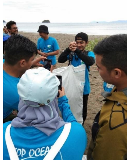
Gambar 6. Kegiatan Penimbangan sampah

Berdasarkan tabel 1 diatas, maka jenis sampah botol plastik paling banyak ditemukan. Sebanyak 500 botol plastik dari berbagai merek ditemukan di pantai Lamtengoh, dengan berat 51,1 kg yang paling mendominasi. Selanjutnya sampah plastik kresek dengan berat 6,3 kg dan plastik sachet 5,3 kg. Jenis sampah pipet/sedotan plastik juga masih banyak ditemui di pantai ini. Ada sebanyak 65 sedotan plastik yang berhasil dikutipkan pada saat kegiatan itu. Kategori sampah campuran juga tergolong banyak, dengan berat 6,8 kg. Hal ini menunjukkan bahwa di lokasi pantai Lamtengoh masih banyak masyarakat yang suka membuang sampah plastik sembarangan. Di lokasi pantai tersebut juga belum menyediakan tempat buang sampah yang khusus, sehingga banyak pengunjung dan masyarakat yang masih suka membuang sampah secara sembarangan.