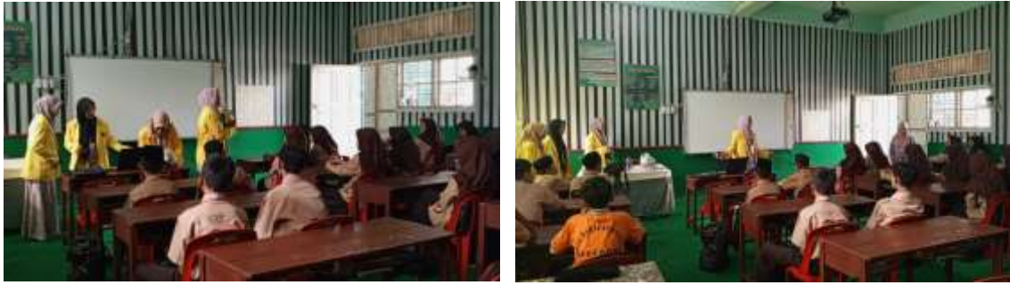
Gambar 2. Dokumentasi Kegiatan (Pemaparan Materi)

Sebagai bagian dari pendekatan praktis, pelaksanaan kelas literasi gizi mengintegrasikan kegiatan praktek yang melibatkan peserta secara langsung. Peserta diajarkan untuk membaca label gizi pada kemasan makanan, memahami informasi yang terkandung di dalamnya, dan menghitung besaran gizi berdasarkan porsi yang dikonsumsi. Rumus dan contoh perhitungan disampaikan secara jelas, memberikan siswa alat yang diperlukan untuk membuat keputusan makanan yang lebih cerdas.