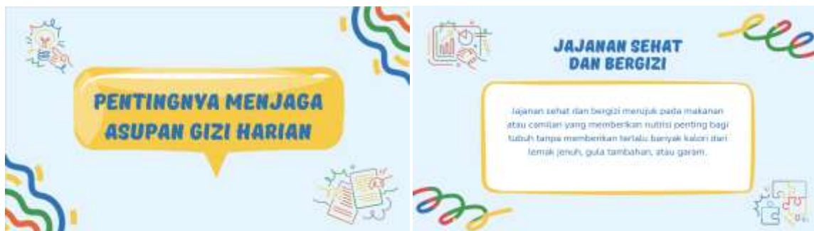
Gambar 1. Media PPT Kelas Literasi Gizi

Pelaksanaan kegiatan dimulai dengan pembukaan yang dilaksanakan oleh tim pengabdian kepada masyarakat. pelaksanaan pembukaan dilaksanakan dengan mengucapkan salam pembuka yang dilanjutkan dengan memperkenalkan seluruh anggota tim pengabdian. Setelah itu sesi dilanjutkan dengan penjelasan maksud dan tujuan kegiatan yang akan dilakukan kepada seluruh peserta. Setelah peserta dirasa paham terkait maksud dan tujuan kegiatan maka anggota tim membagikan lembar pre test untuk di isi oleh peserta. peserta diberikan waktu 10 menit untuk mengisi lembar pretest yang telah disiapkan.