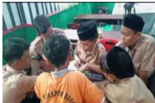
Gambar 3. Dokumentasi Kegiatan (Praktik Menghitung Asupan Gizi Harian)

Sebagai bagian dari pendekatan praktis, pelaksanaan kelas literasi gizi mengintegrasikan kegiatan praktek yang melibatkan peserta secara langsung. Peserta diajarkan untuk membaca label gizi pada kemasan makanan, memahami informasi yang terkandung di dalamnya, dan menghitung besaran gizi berdasarkan porsi yang dikonsumsi. Rumus dan contoh perhitungan disampaikan secara jelas, memberikan siswa alat yang diperlukan untuk membuat keputusan makanan yang lebih cerdas.