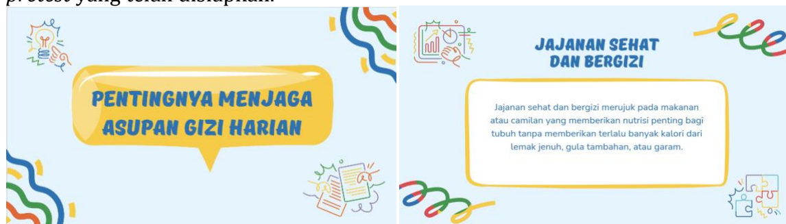
Gambar 1. Media PPT Kelas Literasi Gizi

Pelaksanaan kegiatan dimulai dengan pembukaan yang dilaksanakan oleh tim pengabdian kepada masyarakat. pelaksanaan pembukaan dilaksanakan dengan mengucapkan salam pembuka yang dilanjutkan dengan memperkenalkan seluruh anggota tim pengabdian. Setelah itu sesi dilanjutkan dengan penjelasan maksud dan tujuan kegiatan yang akan dilakukan kepada seluruh peserta. Setelah peserta dirasa paham terkait maksud dan tujuan kegiatan maka anggota tim membagikan lembar pre test untuk diisi oleh peserta. peserta diberikan waktu 10 menit untuk mengisi lembar pretest yang telah disiapkan.