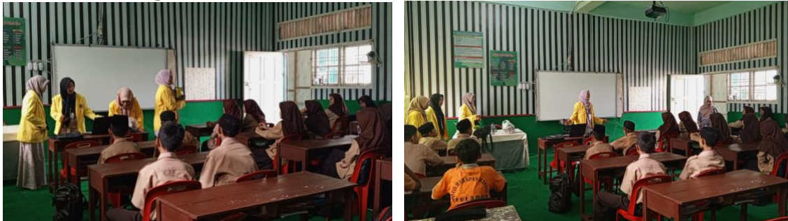
Gambar 2. Dokumentasi Kegiatan (Pemaparan Materi)

Sebagai bagian dari pendekatan praktis, pelaksanaan kelas literasi gizi mengintegrasikan kegiatan praktek yang melibatkan peserta secara langsung. Peserta diajarkan untuk membaca label gizi pada kemasan makanan, memahami informasi yang terkandung di dalamnya, dan menghitung besaran gizi berdasarkan porsi yang dikonsumsi. Rumus dan contoh perhitungan disampaikan secara jelas, memberikan siswa alat yang diperlukan untuk membuat keputusan makanan yang lebih cerdas.