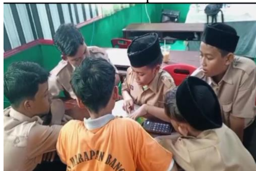
Gambar 3. Dokumentasi Kegiatan (Praktik Menghitung Asupan Gizi Harian)

Sebagai bagian dari pendekatan praktis, pelaksanaan kelas literasi gizi mengintegrasikan kegiatan praktek yang melibatkan peserta secara langsung. Peserta diajarkan untuk membaca label gizi pada kemasan makanan, memahami informasi yang terkandung di dalamnya, dan menghitung besaran gizi berdasarkan porsi yang dikonsumsi. Rumus dan contoh perhitungan disampaikan secara jelas, memberikan siswa alat yang diperlukan untuk membuat keputusan makanan yang lebih cerdas.