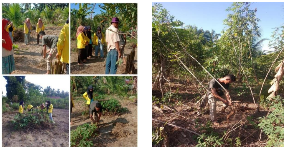
Gambar 2. Proses tanam dan panen singkong di Desa Sukarejo

Survey lapangan pada lokasi yang ditentukan merupakan langkah awal yang sangat penting yang bertujuan untuk merencanakan suatu kegiatan. Dari hasil survey pengolahan keripik singkong di Desa Sukarejo ditemukan bahwa keripik singkong dari Desa Sukarejo memiliki potensi pasar yang besar, baik di tingkat lokal maupun nasional. Analisis awal menunjukkan adanya permintaan yang tinggi untuk produk makanan ringan yang alami dan berkualitas. Gambar 2 menampilkan kegiatan penanaman dan pemanenan singkong.