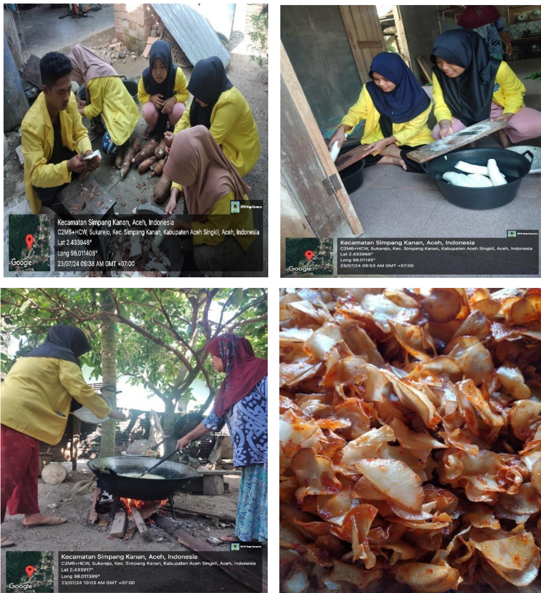
Gambar 3. Proses Pembuatan Keripik Singkong

Keripik singkong yang dihasilkan memiliki kualitas tinggi dengan cita rasa yang khas. Uji coba rasa menunjukkan bahwa produk ini diterima dengan baik oleh konsumen. Untuk menjaga kualitas tinggi tersebut, maka perlu dipastikan proses pengolahan dengan standar yang baik. Alur proses perlu dijaga yang dimulai dari pengolahan bahan baku mentah hingga menjadi produk yang berkualitas. Proses pengolahan singkong menjadi keripik singkong di Desa Sukarejo seperti tampak pada Gambar 3.